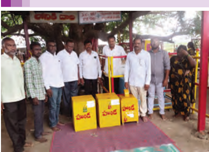
మెట్ పల్లి (సాక్ష్యం స్టూన్ ) మెట్ పల్లి మండలం వెల్లుల్ల ఎల్లమ్మ దేవాలయం దేవదాయ శాఖ