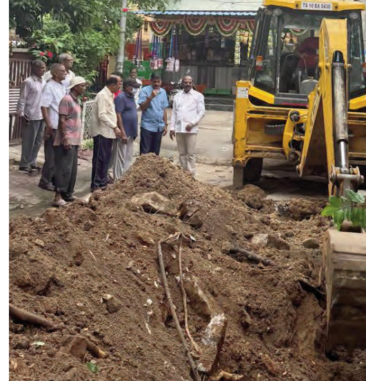
Latitude: 17.191189 Longitude: 79.129951 Elevation: 176.111114 m Accuracy: 7.847 m View: 07.05.2025 09:52