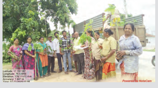
Latitude: 17.191189 Longitude: 79.129951 Elevation: 176.111114 m Accuracy: 7.847 m View: 07.05.2025 09:52