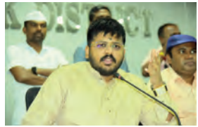
పై ప్రణాళికతో ముందడుగులో ఉండకపోవడం మీ అధికార నిర్లక్ష్యానికి నిదర్శనం అని మండిపడ్డారు.

మెడక్ జిల్లా ప్రతినిధి సాక్ష్యం స్టూన్ 22 మే జిల్లా అధికారులచే