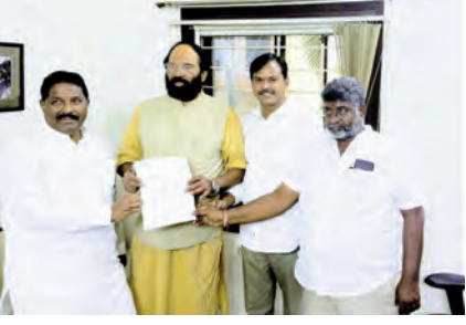
సర్పంచ్ మే 22 ( సాక్ష్యం స్టూన్ ) : అకాల వర్షంతో తడిసిన ధాన్యాన్ని బాయిల్డ్ రైస్ గా పరిగణించి ప్రభుత్వం కొనుగోలు చేయాలని