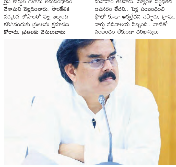
రేషన్ కార్డుల్లో మార్పులు, చేర్పులకు దరఖాస్తు చేసుకునే అవకాశం ఏపీ పౌరసరఫరాల శాఖ మంత్రి మంత్రి నాదెండ్ల వెల్లడి

విజయవాడ,మే22(సాక్ష్యం): రేషన్ కార్డు కోసం కొత్త దరఖాస్తు చేసుకున్నవారు ఎలాంటి అందోకరం చెందకుండా అవసరం లేదని ఏపీ పౌరసరఫరాల శాఖ మంత్రి మంత్రి నాదెండ్ల మనోహర్ అన్నారు. దరఖాస్తు స్వీకరించిన 21 రోజుల్లో దాన్ని పరిష్కరిస్తామని తెలిపారు. విజయవాడలో నిర్వహించిన మీడియా సమావేశంలో మంత్రి మాట్లాడారు. రాష్ట్ర వ్యాప్తంగా మే 7 నుంచి రేషన్ కార్డుల్లో మార్పులు, చేర్పులు చేపట్టామని.. ఇ-కెవెసీ తప్పనిసరి అని కేంద్రం సుప్లయ్ చేసినట్లు మంత్రి తెలిపారు. కుటుంబ విభజన కోసం 44వేల మంది దరఖాస్తు చేశారని చెప్పారు. ఫంజీ ఆఫ్ అప్లైడ్ కోసం 12,500 మంది దరఖాస్తులు పెట్టుకున్నట్లు తెలిపారు. కూటమి ప్రభుత్వం వచ్చిన తర్వాత గ్రామ, వార్డు సచివాలయాలకు