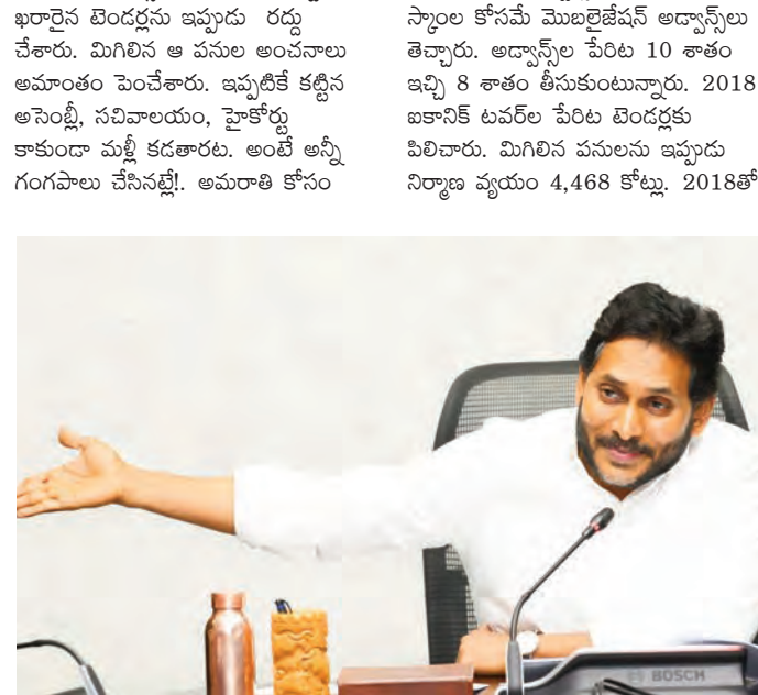
చంద్రబాబు అప్పల మీద అప్పులు చేస్తున్నారని మండిపడ్డారు. అక్రమాలకు అడ్డుకాకూడదని.. మా హయాంలో తెచ్చిన అప్పులను సమగ్రం దగ్గర ఉంటూ మనలని రక్షిస్తాయన్నారు.అయితే, ఇటీవల మద అడవులను కూడా నాశనం చేస్తున్నారని వ్యాఖ్యానించారు.

సాంత అప్పులను పెంచుకునేలా అప్పులు గతంలో టెండర్ల పనులకూ..నేటికీ పాంతన ఏదీ నాడు ఖరారైన టెండర్ల విలువ రూ.41, 107 కోట్లు మాత్రమే అప్పటికే 6వేల కోట్ల పనులు పూర్తి చేశారు