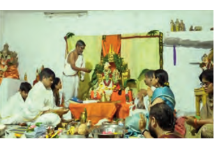
అల్వాల్ సరిక్ మే 22 (సాక్ష్యం స్టూన్) టెంపల్