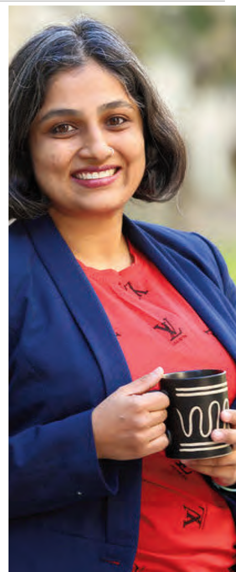
మించిన సమయం ఉండదు. నేటి పొదుపు బాట, రేపటికి ఆర్థిక బాసట.

తల్లిదండ్రులు ఏం చేయాలంటే... 1. పిల్లల్ని బడ్జెట్ మేసుకోమనండి. అవసరాలు, పొదుపు, సరదాలు... మూడు విభాగాలుగా ఖర్చుల్ని విభజించుకోమనండి. 2. స్నేహితుల్లో ఈరోజు ఒకరు సినిమా అంటే, మరొకరు ఇంకొకరు షాపింగ్ అంటారు. అన్నింటికీ సిద్ధమైపోకుండా భాగ్యం పడవనాలి. వీటికి వెళ్లకపోవడం త్యాగం కాదు, తెలివైన నిర్ణయం. సమయం, డబ్బు రెండూ ఆదా అని వివరంగా చెప్పండి. 3. చాలావరకూ పైచెదువులకు రుణాలు తీసుకుంటున్నారు. డిగ్రీ పూర్తవగానే ఈపని మొదలుపెట్టుకుంటుంది. అందుకు ఆర్థిక క్రమశిక్షణ అవసరమని చెప్పండి. విద్యార్థులు ఏం చేయాలంటే.. 1. బెటెరింగ్ కోసం కొంత మొత్తం అనుకుని దాన్లోనే ఖర్చు చేయండి. 2. మీ బడ్జెట్ సహకరించకపోతే, బెస్ట్ ఫ్రెండ్ అయిన ఈసారి కుదరదు, తర్వాత చూద్దామని చెప్పండి. 3. చదువు పూర్తవగానే లోన్ తీర్చాలి. అంటే ఉద్యోగం తప్పనిసరి. చదువు ప్రాధాన్యాన్ని ఆర్థం చేసుకోండి. చదువు, ఉద్యోగం, డబ్బు... వీటి విషయంలో ప్రణాళిక, క్రమశిక్షణతో ఉండండి. 4. ఖర్చులకు తల్లిదండ్రులు ఇచ్చిన మొత్తంలో నెలాఖరుకు రూ.500 మిగిల్చి చూడండి. ఎంత సంతృప్తినిస్తుందో! 5. ఆర్థిక విషయాల నేర్చుకోవడానికి కాలేజీ రోజులకి