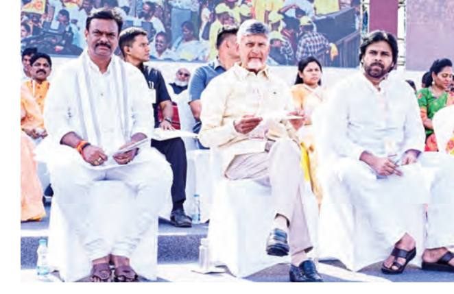
మూసకొని.. సోషల్ మీడియా అఫీసులు రాకుండా.. రష్ట్రా రష్ట్రా అంటూ రంకెలేస్తున్నారు. రష్ట్రా రష్ట్రా అంటే

కార్యక్రమాల కాలం ఎగరేసుకొని తిరిగిలా పాలన అందిస్తున్నాం. ఏపీకి సహకరిస్తున్న ప్రధాని మోడీకి ధన్యవాదాలు. మనం పాలకులం కాదు.. సేవకులం. అవినీతి మన దరి చేరనియ్యకూడదు. మూడు పార్టీల కార్యక్రమాలలో ఇకమళ్లూ ఉండాలి. రాష్ట్రంలో హెల్త్, వెల్ఫేర్, హ్యాపీ సాసైటీ - ఉ