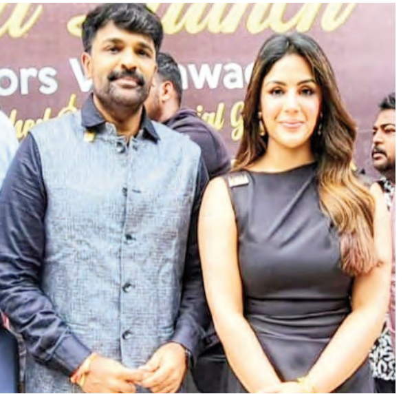
కలర్స్ హెల్త్ కేర్ నిర్మాణాలకు అభినందనలు. ఆందరూ

ఆందంగా, ఆరోగ్యంగా ఉండాలని మనసారా కోరుకుంటాం. అలాంటి ఆఫ్టర్ దరకరమైన, విశ్వసనీ