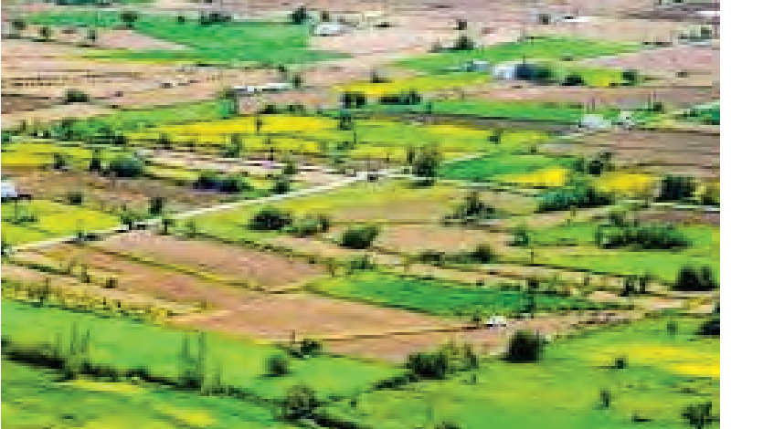
లభించడంతో వారికి పాస్ బుక్స్ వస్తాయి. బ్యాంకు కలలు నిలబ కానున్నాయి. రైతులు తమ రుణాలు పొందే అవకాశం ఉంటుంది. వారసత్వ హక్కులు, విక్రయం, భూమి రక్షణలో ఇకపై సమస్యలు తలెత్తవు. అంతేకాదు, భూమి రికార్డులు

మొదటిపేజీ తరువాయి.. ఎదుర్కొనవల్సి వస్తోంది. ఈ తరహా కాగితాలనే సాధారణజనాలు అని పిలుస్తారు. భూమి రిజిస్ట్రేషన్ ప్రతి రైతుకు అత్యంత ముఖ్యమైన అంశం. ఎందుకంటే రిజిస్ట్రేషన్ లేకుండా అన్ని పాకులు నిరాపిచరం కష్టం అవుతుంది. గతంలో భూముల కొనుగోలు, అమ్మకాలు కేవలం సంకలనంతో కుదిరినా, ఆ పత్రాలను బ్యాంకులు లేదా ప్రభుత్వ సంస్థలు అంగీకరించలేదు. రైతులు సాగు చేస్తున్న భూములపై పూర్తి హక్కు పొందేందుకు 1970లలో ప్రభుత్వం సాధారణజనాల పద్ధతిని ప్రవేశపెట్టింది. దీని ద్వారా అప్రకటిత లావాదేవీలను సక్రమం చేసే అవకాశం లభించింది. 2020 వరకు ఈ పద్ధతిలో దరఖాస్తులను ఆన్లైన్ ద్వారా స్వీకరించారు. అయితే ఆర్.ఓ.ఆర్ చట్టంలో తగిన మార్పులు లేకపోవడంతో హైకోర్టు స్టే విధించింది. ఫలితంగా దాదాపు 9.89 లక్షల మంది రైతుల దరఖాస్తులు పెండింగ్ లోనే నిలిచిపోయాయి. తాజాగా హైకోర్టు ఆ స్టే ఎత్తివేయడంతో మరోసారి రైతులకు ఆశ కలిగింది. ప్రస్తుతం తెలంగాణ రెవెన్యూ శాఖ సాధారణజనాల పరిష్కారం కోసం నోటిఫికేషన్ విడుదల చేసింది. దీని ద్వారా సుమారు 11 లక్షల ఎకరాల భూములకు 13-బి ప్రాసీడింగ్ జారీ అయ్యే అవకాశం ఉంది. కాంగ్రెస్ ప్రభుత్వం ఎన్నికల హామీ మేరకు ఈ సమస్యను పరిష్కరించేందుకు