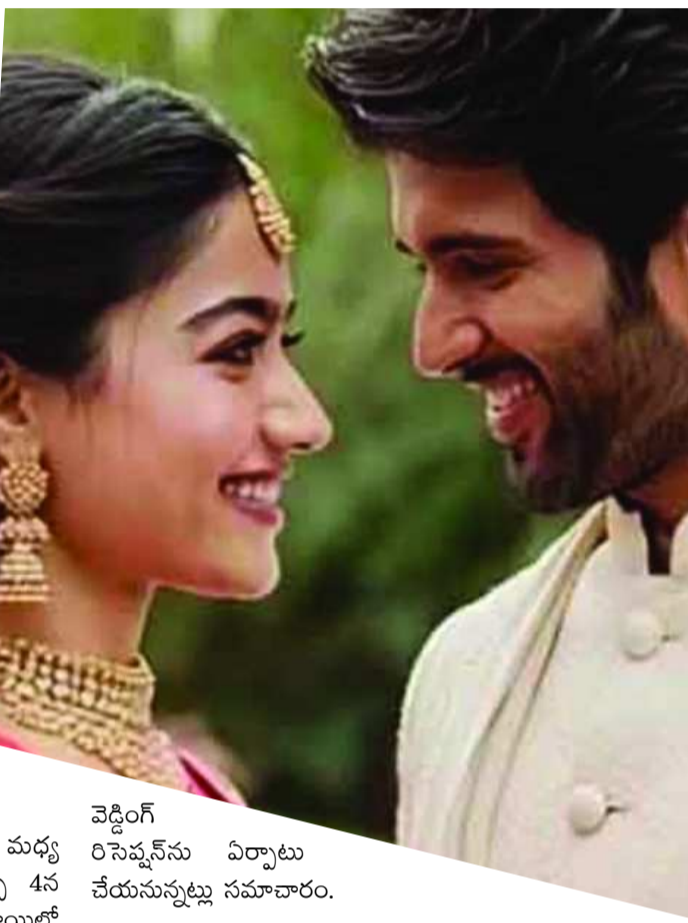
వెడ్డింగ్ రిసెప్షన్ను ఏర్పాటు చేయనున్నట్లు సమాచారం. హైదరాబాద్లో సినీ, రాజకీయ ప్రముఖుల కోసం భారీస్థాయిలో

టాలీవుడ్ స్టార్ జంట విజయ్ దేవరకొండ, రష్మిక మందన్న ఎట్టకేలకు ఒక్కటయ్యారు. తమ రిలేషన్షిప్పై కొన్నేళ్లుగా వస్తున్న ఊహగానాలకు తెరదించుతూ ఇవాళ ఉదయం 10:10 గంటలకు రాజస్థాన్లోని ఉదయ్పూర్లో వీరి వివాహం జరిగింది. విజయ్, రష్మిక మెడలో మాడు ముళ్లు వేసి ఆమెను తన జీవిత భాగస్వామిగా స్వీకరించారు. ఈ వివాహ వేడుక రెండు విభిన్న సంస్కృతుల కలయికగా అత్యంత వైభవంగా జరుగుతోంది. ఉదయం విజయ్ కుటుంబ పద్ధతిలో హిందూ సంప్రదాయం ప్రకారం పెళ్లి తంతు పూర్తికాగా, గురువారం సాయంత్రం 4:30 గంటలకు రష్మిక కుటుంబ ఆచారాల ప్రకారం మరోసారి వివాహం నిర్వహించారు. ఈ వేడుకకు పలువురు సినీ ప్రముఖులు హాజరై నూతన వధూవరులను ఆశీర్వదించారు. పెళ్లికి ముందు జరిగిన వేడుకలు సోషల్ మీడియాలో సందడి చేస్తున్నాయి. హాల్లీ వేడుక ఫోటోలను ఈ జంట ఇన్స్టాగ్రామ్లో పంచుకోగా, అభిమానులు పెద్ద ఎత్తున స్పందించారు. అంతకుముందు 'విరోష్ ప్రీమియర్ లీగ్' పేరుతో నిర్వహించిన క్రికెట్ మ్యాచ్ సైతం వైరల్గా మారింది. తమ అభిమాన జంట పెళ్లి చేసుకోవడంతో 'విరోష్' హ్యాష్ట్యాగ్తో నెటిజన్లు శుభాకాంక్షలు తెలుపుతున్నారు.