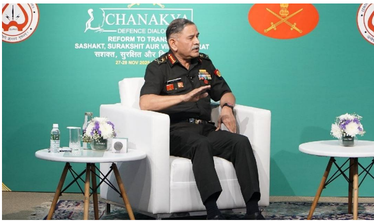
ఉగ్రవాదానికి మద్దతిస్తే తీవ్ర పరిణామాలు తప్పవు

మన గళం, న్యూఢిల్లీ : భారత్పై ప్రతిస్పందన ఇస్తామని ఆయన స్పష్టం చేశారు. పాకిస్థాన్తో వ్యవహారం విషయంలో భారత్ ప్రభుత్వం కొత్త విధానాలను అమలు చేస్తున్నట్లు పేర్కొన్న ఆయన, ఉగ్ర మూఠాలకు సహాయం చేసే ధోరణి కొనసాగితే పాకిస్థాన్ అస్థిత్వమే ప్రమాదంలో పడే పరిస్థితి వస్తుందని హెచ్చరించారు. దేశ