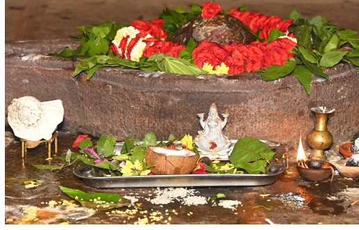
కాగా శిధిలావస్థలో ఉన్న ఈ మఠాలలో ఘంటామఠం, విభూతిమఠం, రుద్రాక్షమఠాలను దేవస్థానం పూర్తిగా పునరుద్ధరించింది. ప్రాచీన నిర్మాణశైలికి ఎలాంటి విఘాతం కలుగకుండా ఈ పునర్నిర్మాణ పనులు పూర్తి చేయబడ్డాయి. అదేవిధంగా భీమశంకర మఠానికి తగు మరమ్మత్తులు కూడా చేయబడ్డాయి. ఈ మఠాలలోని దేవతామూర్తులకు నిత్యపూజలను నివేదన కైంకర్యాలు జరిపించడం జరుగుతుంది.

ఘంటామఠంలోని గణపతికి పూజాదికాలు నిర్వహించబడ్డాయి. తరువాత అన్ని మఠాలలో సంప్రదాయబద్ధంగా అభిషేకాది అర్చనలను నిర్వహించబడ్డాయి. కాగా శ్రీశైల సంస్కృతిలో చాలాకాలం పాటు మఠాలు ప్రధానపాత్ర పోషించాయి. ప్రస్తుత సాధారణశకం 7వ శతాబ్దం నుంచి నిర్వహించబడ్డ ఈ మఠాలు, గర్భాలయం, అంతరాలయం, ముఖమండపం లాంటి నిర్మాణాలను కలిగివుండి, చూడటానికి ఆలయాల మాదిరిగానే కనిపిస్తాయి. కొన్ని శతాబ్దాల నుండి కూడా ఈ మఠాలన్నీ క్షేత్ర ప్రశాంతతలోనూ, ఆలయ నిర్వహణలోనూ, ఆధ్యాత్మికపరంగా, భక్తులకు సదుపాయాలను కల్పించడంలోనూ ప్రధాన భూమికను వహించాయి. శ్రీశైలంలో కొన్ని మఠాలు కాలగర్భములో కలిసిపోగా, ప్రస్తుతం ఆలయానికి దగ్గరలో వాయువ్య భాగాన ఘంటామఠం, భీమశంకరమఠం, విభూతిమఠం, రుద్రాక్షమఠం, సారంగధరమఠం అనే మఠాలు పంచమరాలనే పేర్లతో పిలువబడుతున్నాయి.