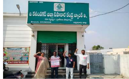
అధికారుల ఆమోదంతో 2023-2024 మరియు 2025 సంవత్సరాలకు గాను ఇన్సెంటివ్ మంజూరు