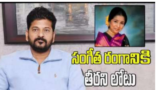
అత్యున్నత పురస్కారాలతో గౌరవించిన గుర్తు చేశారు..

తెలంగాణ గాయని ఆశా భోంస్లే మరణంపై రాష్ట్ర సినిమాటోగ్రఫీ శాఖ మంత్రి కోమటిరెడ్డి వెంకట్ రెడ్డి తీవ్ర దిగ్భ్రాంతి వ్యక్తం చేశారు. ఆశా భోంస్లే మరణం కేవలం సినీ రంగానికే కాకుండా, యావత్ సంగీత ప్రపంచానికి తీరని లోటన్నారు. ఏడు దశాబ్దాలకు పైగా వేల సంఖ్యలో పాటలు పాడి.. సంగీత ప్రియులను అలరించిన ఆమె గొంతు అమరం అంటూ కీర్తించారు. ఆశా భోంస్లే శాస్త్రీయ సంగీతం నుంచి పాప్ సాంగ్స్ వరకు, అన్ని భాషల్లో తనదైన ముద్ర వేసిన గొప్ప గాయని అన్నారు. సంగీత రంగంలో ఆమె సేవలకు గుర్తింపుగా కేంద్ర ప్రభుత్వం ఆమెను 'దాదాసాహెబ్ ఫాల్కే', 'పద్మ విభూషణ్' వంటి