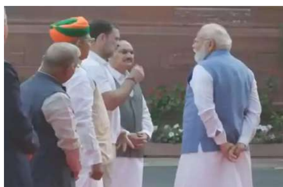
పార్లమెంట్ ప్రాంగణంలో శనివారం ఉదయం ఓ ఆసక్తికర సన్నివేశం చోటుచేసుకుంది. ఎప్పుడూ ఒకరిపై ఒకరు ఆలోపణలు చేసుకొనే ప్రధానమంత్రి మోదీ- కాంగ్రెస్ నాయకుడు రాహుల్ గాంధీతో కొద్దిసేపు ముచ్చటించారు. ఆ దృశ్యాలు సోషల్ మీడియాలో వైరల్ అవుతున్నాయి. జ్యోతిబా పులే 200వ జయంతి సందర్భంగా నివాళు లర్పించేందుకు రాష్ట్రపతి, ప్రధాని సహా పలువురు నాయకులు పార్లమెంట్ ప్రాంగణంలోని ప్రేరణా స్థలకు వచ్చారు. పేజీ 2లో