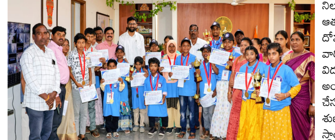
విజయాలు సాధించడం ప్రతి ఒక్కరికీ ఆదర్శంగా