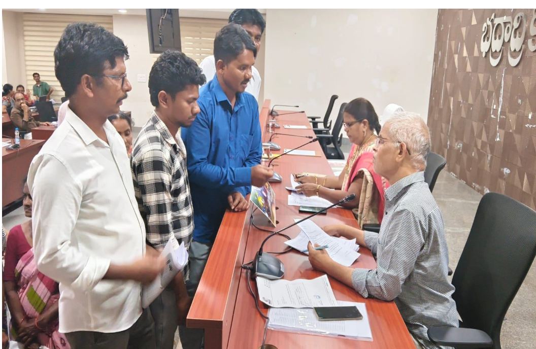
దుర్నియోగంపై సమగ్ర విచారణ జరిపి బాధ్యులపై కఠిన చర్యలు తీసుకోవాలని డిమాండ్ చేశారు.

- ఇందిరమ్మ ఇళ్లలో భారీ గోల్ మాల అరోపణలు - 20 ఏళ్ల క్రితం మంజూరు... పేదల పేర్లపై నిధులు మాయం మన మహాత్మి న్యూస్ కొత్తగూడెం పేదల ఆశల పథకంగా నిలబడ్డైన ఇందిరమ్మ ఇళ్ల పథకం సాటివారి గూడెం గ్రామ పంచాయతీలో అవకతవకల కూపంగా మారడంన్న ఆరోపణలు వెల్లువెత్తుతున్నాయి. కాగితాలపై ఇళ్లు మంజూరు చేసి నిధులు ద్రా చేసినప్పటికీ వాస్తవానికి భూమిపై ఒక్క ఇల్లు కూడా కనిపించకపోవడం సంచలనంగా మారింది. లక్ష్మీదేవిపల్లి మండలానికి చెందిన పలువురు బాధిత కుటుంబాలు తమకు ఇప్పటికీ సొంత ఇల్లు లేక ఇబ్బందులు పడుతున్నామని వాపోతున్నారు. అయితే అధికార రికార్డుల్లో మాత్రం తమ పేర్లపై దాదాపు 20 సంవత్సరాల క్రితమే ఇందిరమ్మ ఇళ్లు మంజూరు చేసి నిధులు కూడా విడుదల చేసినట్లు చూపిస్తున్నారని తెలిపారు. ఈ నిధులు ఎవరి చేతుల్లోకి వెళ్ళాయో ఎవరూ వినియోగించుకున్నారో తెలియక తాము నష్టపోయామని ఆవేదన వ్యక్తం చేశారు. ఇల్లు లేని మాకు కాగితాలపై ఇళ్లు చూపించడం ఎంత వరకు న్యాయం? అంటూ బాధితులు ప్రశ్నిస్తున్నారు. ఎవరో చేసిన తప్పుకు తామే బలయ్యామని తమకు రావాల్సిన ఇల్లు ఇప్పటికీ దక్కలేదని వారు ఆవేదన వ్యక్తం చేశారు. ఈ వ్యవహారంపై బాధితులు జిల్లా అధికారులను ఆశ్రయించి గ్రీవెన్స్ కార్యక్రమంలో ఫిర్యాదు చేశారు. తక్షణమే తమకు ఇందిరమ్మ ఇళ్ల మంజూరు చేయాలని అలాగే గతంలో తమ పేర్లపై మంజూరైన నిధుల