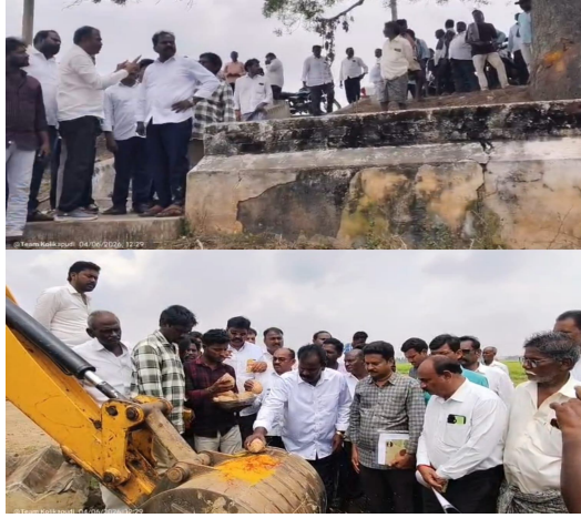
చేసే రైతులకు సమృద్ధిగా సాగునీరు అందించేలా చర్యలు