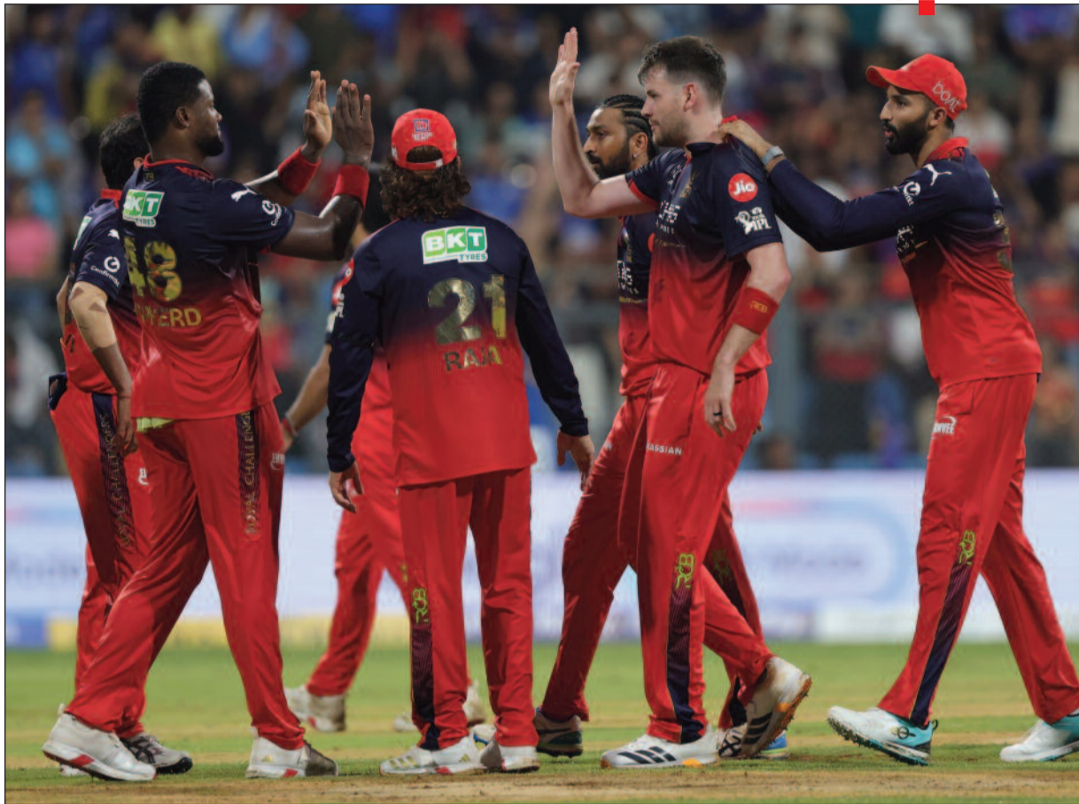
సాట్, కోహ్లా, పటిదార్ వీర విహారం

ముంబై: డిఫెండింగ్ చాంపియన్ రాయల్ చాలెంజర్స్ బెంగళూరు(ఆర్సీబీ) అదరగొట్టింది. ఆదివారం వాంఖడే వేదికగా జరిగిన హైస్కోరింగ్ మ్యాచ్లో ఆర్సీబీ 18 పరుగుల తేడాతో ముంబై ఇండియన్స్పై అద్భుత విజయం సాధించింది. ప్రముఖ సింగర్ ఆశా భోంస్లేకు ఘన నివాళులు అర్పించిన ఇరు జట్ల షేయర్లు నల్లరిబుచ్చు