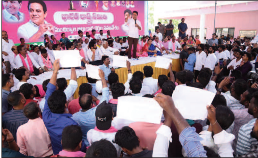
ఇవ్వడంతో లోపాలు తరిస్తారన్నారు.

పాత్రులు మాకు కలిసి రావు ఒంటరిగానే పోటీ సమన్వయ లోపంతో దెబ్బతిన్నాం.. లోపాలు సవరించుకుంటాం కేసీఆర్ ఏ బాధ్యత అప్పగిస్తే అందులో నిమగ్నమవుతామే, జూన్ నెలల్లో సభ్యత్వ సమోదయ కార్యక్రమం... గెలుపు గుర్రాలకే టిక్కెట్లీస్తాం డిలమిటేషన్లో పార్టీలో మరన్ని అవకాశాలు అవినీతి కాంగ్రెస్ సర్కార్ ను గద్దె దింపే వరకు అలుపెరుగని పోరాటం చేస్తాం మళ్లీ కేసీఆర్ సీఎం కావాలని ప్రజలు కోరుకుంటున్నారని మంచీర్యాలలో మీడియాతో కేసీఆర్ చీఫ్ చాట్