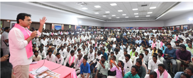
ఎవరిని నిలబెట్టాడా భారీ మెజిస్ట్రేట్ గెలుస్తాం గద్దాల నుంచి పలువురు జరిఎస్ లో చేరిక కందువా కమ్మి ఆహ్వానించిన కేటీఆర్