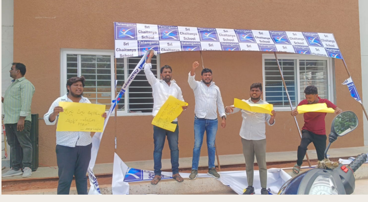
హన్మకొండ జిల్లా జై భీమ్ న్యూస్