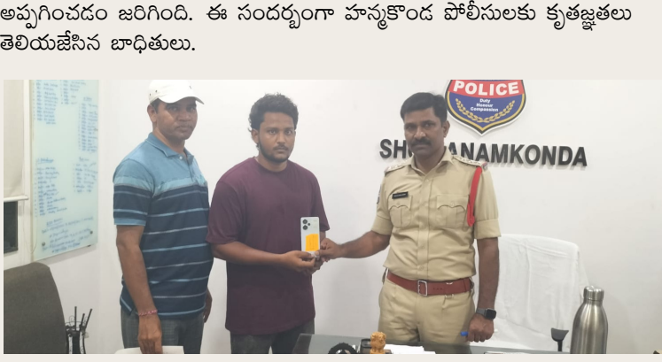
వరంగల్ పోలీస్ కమిషనర్ హన్మకొండ పోలీస్ స్టేషన్ పరిధిలో వివిధ షాపు సెల్ ఫోన్స్ విడిగా పోగాట్టుకున్న 5 గురికి వారి సెల్ ఫోన్స్ ను సీజురీగా పోలీస్ డ్వారా గుర్తించి సెల్ ఫోన్స్ అడ్డీ యజమానులకు అప్పగించడం జరిగింది. ఈ సందర్భంగా హన్మకొండ పోలీసులకు కృతజ్ఞతలు తెలియజేసిన బాధితులు.