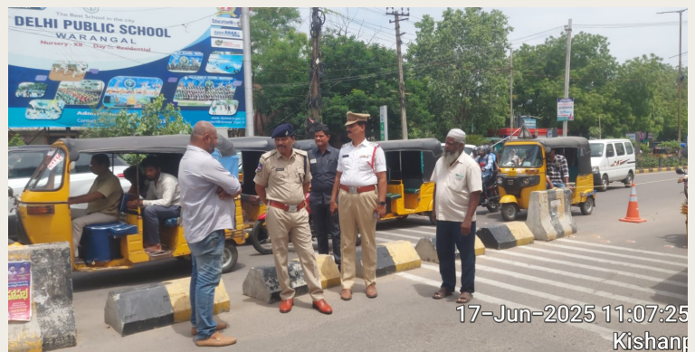
17-Jun-2025 11:07:25 Kishanji

వరంగల్ అడిషనల్ డీసీపీ లా అండ్ ఆర్డర్, ట్రాఫిక్ రాయల ప్రభాకర్ రావు