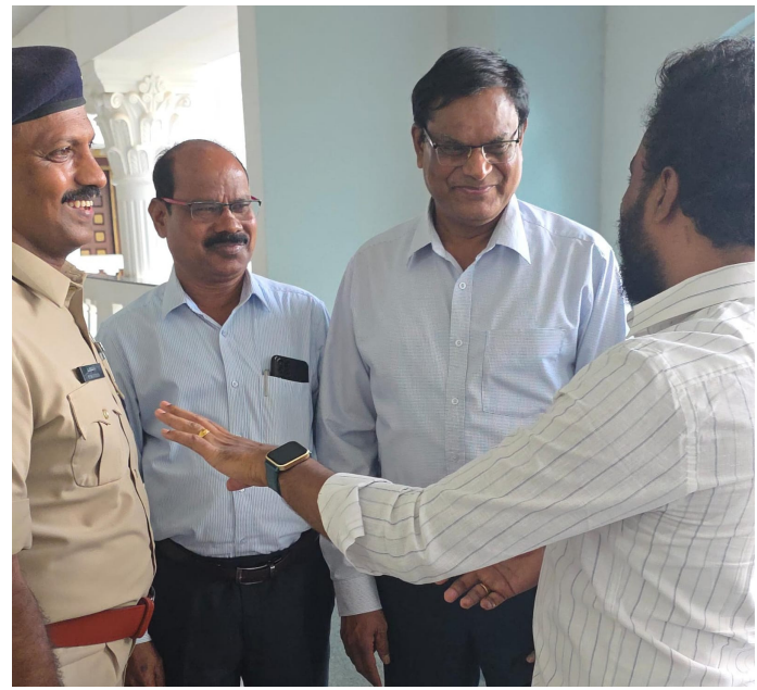
రిపోర్ట్ ఆధారంగా ప్రభుత్వం నుండి కావలసినన్ని నిధులు సేకరించుకొని, తెప్పించుకొని విశ్వవిద్యాలయాన్ని పూర్వ వైభవానికి తీసుకు రాగలరని గర్వంగా చెప్పారు.