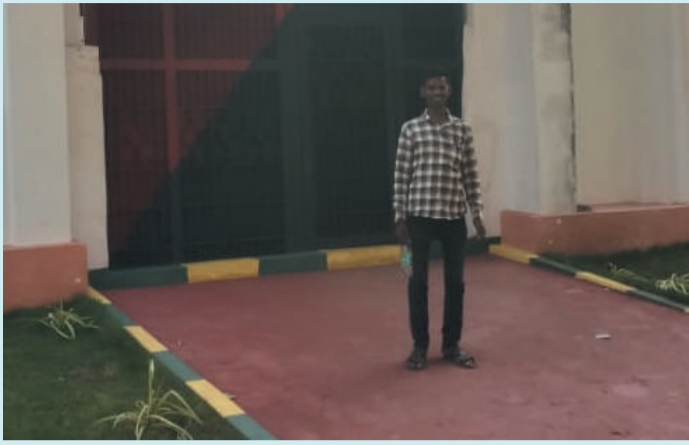
వరంగల్ జై భీమ్ క్రైమ్ న్యూస్