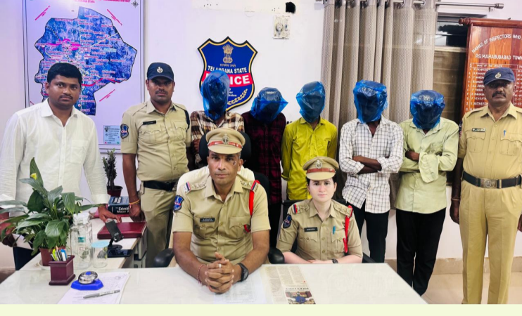
మహబూబాబాద్ జై భీష్మ న్యూస్