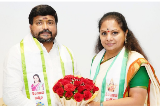
ఉన్న కవిత నే జాగృతి నే ప్రతిపక్ష పాత్ర పోషిస్తున్నట్లుగా ఉన్నది అంటే కవిత పోరాటం ఏ విధంగా ఉన్నదో ఆర్థం అవుతుంది.

విటాన్నింటికంటే మెండుగా మిక్కిలి ధైర్యాశీలి, చెయ్యని నేరానికి తెలుగు ప్రయోజనం పొందటం కోసం అయిదు నెలలు తీహార్ జైల్లో పెడితే కూడా మొక్కువోణీ విశ్వాసం తో ఎదుర్కొని నిలవడ దీర వనిత కవిత, ఏదైనా సమస్య ఎత్తుకుంటే కవిత విజయం సాధించే అంతవరకు వదలదు అనే పేరును అనేక సందర్భల్లో తెలంగాణ సమాజానికి తెలియజేసింది. వజ్ర సంకల్పం మొంది బెయ్యం, పట్టు సడ లించని తెగువ ఇవే కవిత కన్న బిల్లం. .తెసిఆర్ గారి రాజకీయ వారసత్వం నిలబెట్టగలిగే దమ్ము కవితకు మాత్రమే ఉన్నారని ప్రజలు సమ్ముతున్నారు అంటే అతికోయోక్తి కాదు. కాంగ్రెస్ ప్రభుత్వం తెలంగాణ లో అధికారం లోకి రావటం కోసం అనేక తప్పుడు సాధ్యం కానీ హామీలను వ్యాసనలను ఇచ్చి ఈ ప్రాంత బిడ్డలను మోసం చేసి మోసం మా నైజం అని నిరూపించుకున్నారు. ప్రభుత్వం అవాలంభిస్తున్న ఈ ప్రజా వ్యతిరేక నిర్ణయాలను అడుగుడుగనూ ఎండ గడుతూ కాంగ్రెస్ పార్టీ వెంట పడి ఇచ్చిన హామీల అమలుకు కృషి చేస్తూ ఉన్నారు. గురుకుల పిల్ల మరణాలు, ఆలో కార్మికుల సమస్యలు, ఆగ్రన్ వాడీలు, రేషన్ డిల్లర, సర్కారులు, జిల్ సోర్సింగ్ ఉద్యోగుల సమస్యలు, సింగరేణి కార్మికుల సమస్యలు, నిరుద్యోగులు మార, బిసి బిడ్డలకు ఇచ్చిన 42% రిజర్వేషన్స్ ఇలా అనేక అంశాలను ప్రశ్నిస్తూ పోరాట రూపాలను తీసుకుంటు ఈ రాష్ట్రము లో %దీ=గా