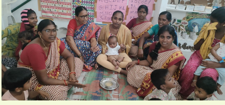
పాపకుండ జిల్లా జై భీమ్ స్టూన్