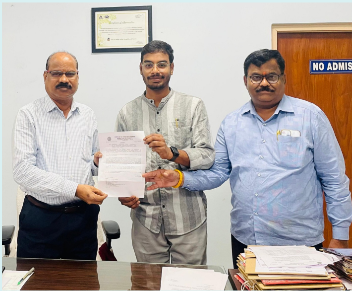
జై భీమ్ న్యూస్ కే. యూ క్యాంపస్