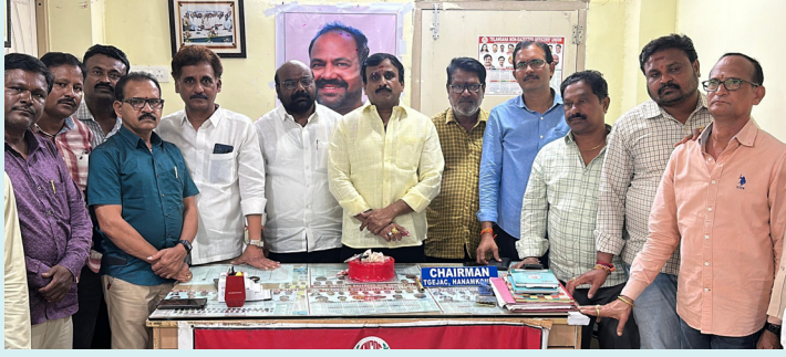
హనుమకొండ జిల్లా జై భీమ్ న్యూస్

ఆకుల రాజేందర్ హనుమకొండ జిల్లా టీ ఎన్ జి ఓన్ జిల్లా అధ్యక్షులు