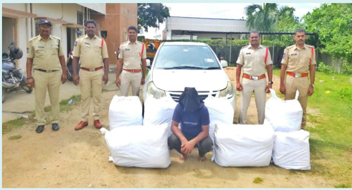
భద్రాద్రి కొత్తగూడెం జిల్లా జై భీమ్ న్యూస్