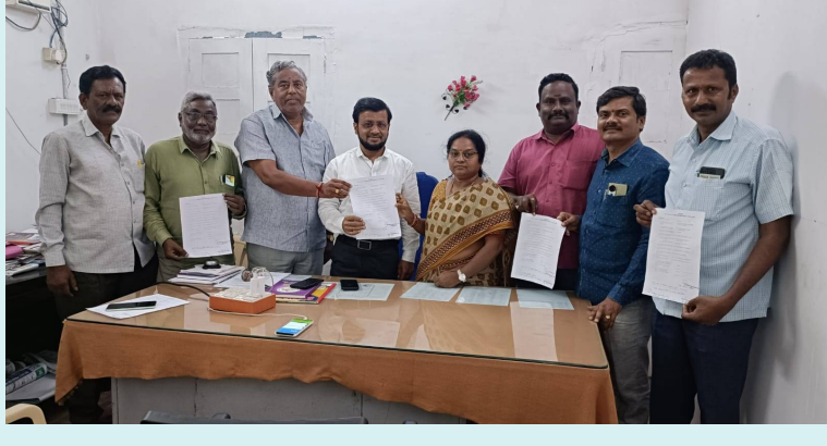
వరంగల్, 17 ఏప్రిల్ 2026 (జై భీమ్ న్యూస్)