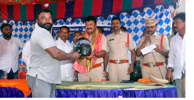
హనుమకొండ, 17 ఏప్రిల్ 2026 (జై భీమ్ న్యూస్)