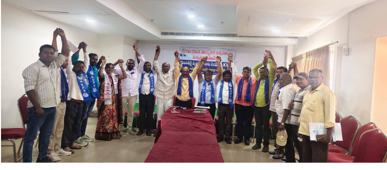
హస్తాంకురం / జై భీమ్ న్యూస్ :