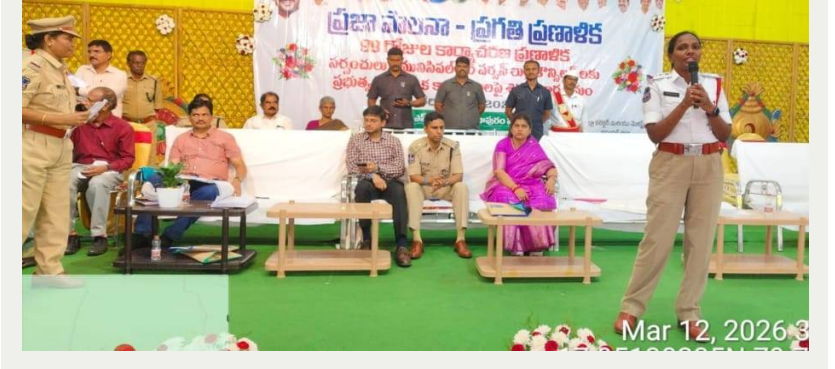
Mar 12, 2026 3:02:19 PM

మహిళల భద్రత, ట్రాఫిక్ నియమాలపై కీలక సూచనలు