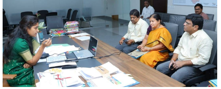
హన్మకొండ, 12 మార్చి 2026(జై భీమ్ న్యూస్)