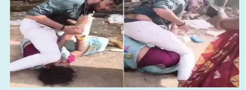
కాకినాడ, జై భీమ్ న్యూస్

కాకినాడ జిల్లా సామర్లకోటలో వెలుగుచూసిన ఘటన