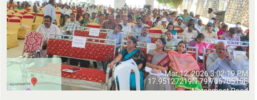
Mar 12, 2026 3:02:19 PM

గీసుగొండ, 12 మార్చి 2026(జై భీమ్ న్యూస్)