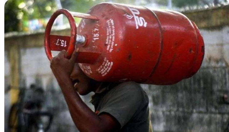
హైదరాబాద్/స్వామి, 6 జనవరి 2026 (జై భీమ్ స్కూల్స్)

సబ్సిడీ సిలిండర్ బుకింగ్ కు అంతరాయం లేకుండా పూర్తి చేయాలని సూచన