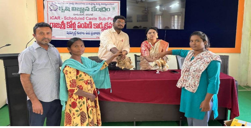
పోషకాహార లోప నివారణతో పాటు అదనపు ఆదాయం ఉ దాక్టర్ డి. బిందు మాధుల