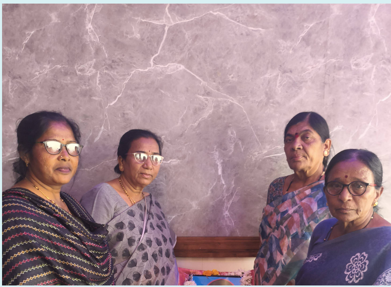
బీదర్ జిల్లా ( కర్ణాటక ) జై భీమ్ స్కూల్స్ :