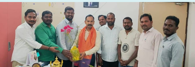
హన్మకొండ, 6 జనవరి 2026 (జై భీమ్ స్కూల్స్)