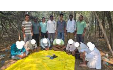
కార్యకలాపాలకు పాల్పడేవారిపై చట్ట ప్రకారం చర్యలు తీసుకుంటామని

పరిధిలోని అసంకల్పాడి గ్రామ పోలీస్ స్టేషన్ పేకాట స్థావరంపై ఆకస్మికంగా దాడులు నిర్వహించి పేకాట ఆడుతున్న ఏడుగురికి వ్యక్తులను అదుపులోకి తీసుకున్నారు. వారి వద్ద నుండి 7 మోటార్ సైకిళ్లు, 7 సెల్ ఫోన్లు మరియు రూ. 46,900/- నగదు స్వాధీనం చేసుకున్నారు. జూద క్రీడలు మరియు ఇతర అసాంఘిక