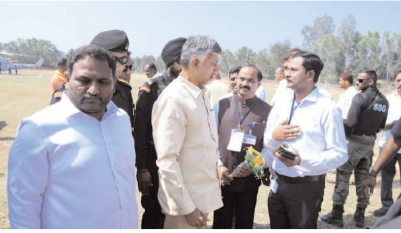
గుడిపల్లి, చిత్తూరు ఎక్స్ ప్రెస్, జూన్ 27:

కుప్పం నియోజకవర్గం గుడిపల్లి మండలంలోని ద్రావిడ విశ్వ విద్యాలయానికి ఇంజనీరింగ్ కళాశాల మంజూరు ముఖ్య మంత్రి విశ్వవిద్యాలయం కృతజ్ఞత కుప్పం నియోజకవర్గంలో విద్యారంగ అభివృద్ధికి ప్రభుత్వం తీసుకుంటున్న ప్రాధాన్యతతో, ద్రావిడ విశ్వవిద్యాలయం పునరుద్ధింపబడుతోంది. రాష్ట్ర ముఖ్య మంత్రి నారా చంద్రబాబు నాయుడు సారథ్యంలో ద్రావిడ విశ్వవిద్యాలయానికి కొత్త ప్రభుత్వ ఇంజనీరింగ్ కళాశాల మంజూరు చేయడం, పట్ల విశ్వవిద్యాలయం పూర్వ య పూర్వక కృతజ్ఞతలు తెలిపింది. ఈ విద్యా సంవత్సరంలో నుంచే బి.టెక్ కంప్యూటర్ సైన్స్ అండ్ ఇంజనీరింగ్ (CSE), CSE ఆర్కిటెక్చర్ ఇంటిగ్రేటెడ్ మెషిన్ టెక్నాలజీ కోర్సు లతో కళాశాల ప్రారంభం కానుంది. ఒక్కో కోర్సులో 60 సిట్లు కేటాయింబబడ్డాయి. ఇది కుప్పం విద్యా రంగానికి సరికొత్త మైలురాయిగా నిలిచే అవకాశం ఉంది. ఇందులో భాగంగా,