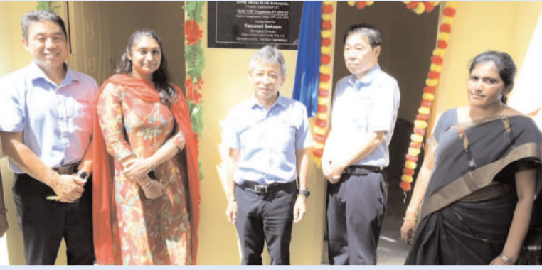
శ్రీసీటీ, చిత్తూరు ఎక్స్ ప్రెస్, జూన్ 27: