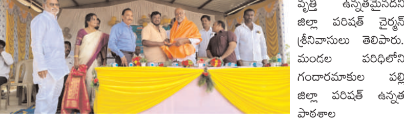
వి.కోట, చిత్తూరు ఎక్స్ ప్రెస్, జూన్ 27: