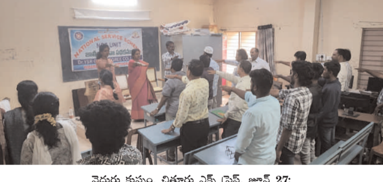
వై.ఎస్.ఆర్ ప్రభుత్వ డిగ్రీ కళాశాల

డా. వై.ఎస్.ఆర్ ప్రభుత్వ డిగ్రీ కళాశాల వేడుకుప్పం నందు ప్రెస్ బి.అన్నపూర్ణ శారద అధ్యక్షతన ఎస్.ఎస్. ఎస్ విభాగం, బి.కృష్ణ.ఎ.సి వర్చువేక్షణలో “నిషా ముక్తీ భారత్ అభి యాన్” కార్యక్ర మాన్ని విజయవంతంగా నిర్వహించారు. దేశంలో మాదకద్రవ్యాల వినియో గాన్ని నిర్మూలించాలనే లక్ష్యంతో కేంద్రప్రభుత్వం చేపట్టిన “నిషా ముక్తీ భారత్ అభియాన్”కు మద్దతుగా ఈ కార్యక్రమాన్ని చేపట్టారు. కార్యక్రమంలో భాగంగా మాదకద్రవ్యాల దుర్ముఖా వాలపై అవగాహన కల్పించారు. విద్యార్థులు, యువత మాదకద్రవ్యాల బారిన పడకుండా తీసుకో వాల్సిన జాగ్రత్తలపై ఉపన్యాసాలు ఇచ్చారు. మాదకద్ర వ్యాల రహిత సమాజాన్ని నిర్మించాల్సిన అవశ్యతను వివరించారు. మాదకద్రవ్యాల నివారణకు తీసుకోవాల్సిన చర్యలపై చర్చాగోష్ఠి నిర్వహించారు. పలువురు విద్యార్థులు మాదకద్రవ్యాల నిర్మూలనపై ప్రతిజ్ఞ చేశారు. ఈ కార్య క్రమం ద్వారా విద్యార్థులలో సమాజంలో మాదకద్రవ్యాల నిర్మూలనపై విస్తృత సమస్యలను కల్పించబడింది. ఎస్.ఎస్. ఎస్ ప్రొగ్రాం కోఆర్డినేటర్, బి.కృష్ణ.ఎ.సి సమన్వయకర్త ఈ కార్యక్ర మాన్ని విజయవంతం చేయడంలో కీలక పాత్ర పోషించారు. మాదకద్రవ్యాల రహిత సమాజ స్థాపనకు అందరూ కృషి చేయాలని ఈ సందర్భంగా పిలుపునిచ్చారు. చివరగా కళాశాల నుండి భారతం మిట్ల సర్టిఫికేట్ ర్యాంప్ మోషన్ హోరం కార్యక్రమాన్ని జయప్రదం చేశారు.