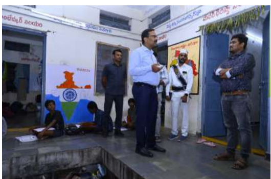
వసతి గృహాలు, ఎంపీడీఓ, తహసీల్దార్ కార్యాలయాల సందర్శన