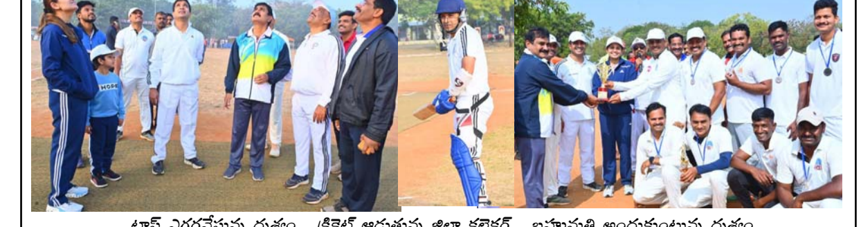
టాన్ ఎగరవేస్తున్న దృశ్యం . క్రికెట్ ఆడుతున్న జిల్లా కలెక్టర్ . బహుమతి అందుకుంటున్న దృశ్యం