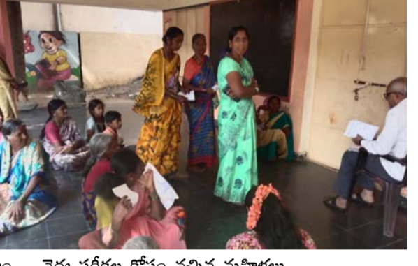
వైద్య పరీక్షల కోసం వచ్చిన మహిళలు