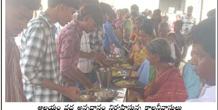
ఆలయం వద్ద అన్నదానం నిర్వహిస్తున్న కాలనీవాసులు