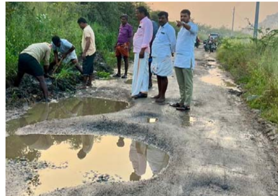
గుంతలమయంగా మారిన ప్రధాన రహదారి

పెద్దకడబూరు, డిసెంబర్ 28 : పెద్దకడబూరు మండల పరిధిలోని చిన్నతుంబకం గ్రామ ప్రధాన ముఖద్వారం (బస్టాండ్) నుండి బాపరం శ్రీ గంగా భవాని దేవాలయం వరకు ప్రధాన రహదారి అత్యంత దయనీయంగా ఉందని గ్రామస్థులు అడివారం ఆవేదన వ్యక్తం చేశారు. మౌళిక సౌకర్యం లేని చిన్నతుంబకం గ్రామ ముఖద్వారం నుంచి గ్రామం వరకు ప్రధాన రహదారి గుంతలమయంగా మారడంతో ప్రజల రాకపోకలకు తీవ్ర అంతరాయం ఏర్పడుతుందన్నారు. గత కొన్ని నెలల క్రితం కురిసిన భారీ వర్షాలకు రాయల చెరువు కడగమ్ము ఎక్కి రహదారిపై ప్రవహించడంతో రహదారిలో గుంతలు పడ్డాయని, వీటిని పట్టించుకోవే నాణ్యత కరమయ్యారని తెలిపారు. ఈ కారణంగా ఆటో డ్రైవర్లు, వాహనదారులు తీవ్ర ఇబ్బందులు ఎదుర్కొంటున్నారన్నారు. ముఖ్యంగా ఈ రహదారి ద్వారా