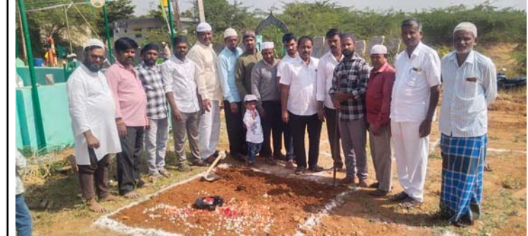
మసీదు నిర్మాణానికి భూమిపూజ చేస్తున్న దృశ్యం