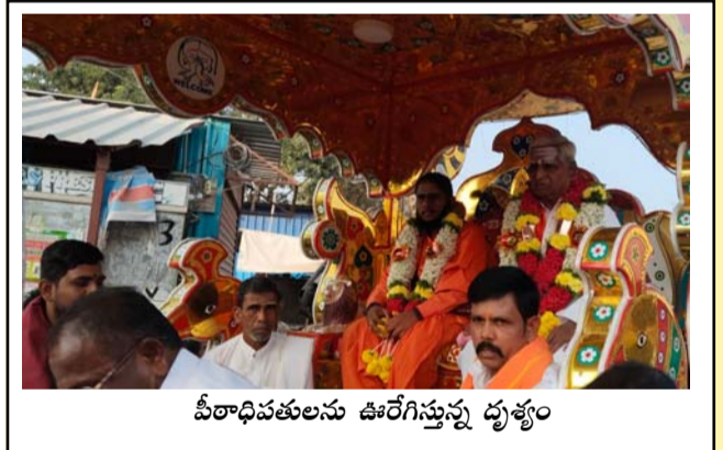
పీఠాధిపతులను ఊరేగిస్తున్న దృశ్యం