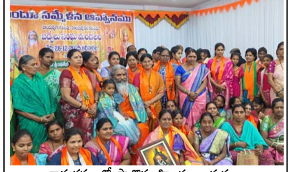
కార్యక్రమంలో పాల్గొన్న హిందూబంధువులు