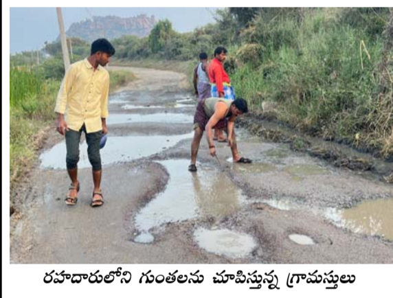
రహదారులోని గుంతలను మాపిస్తున్న గ్రామస్థులు