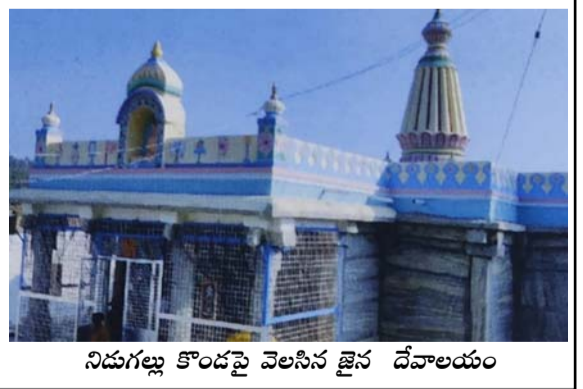
నిడుగల్లు కొండపై వెలసిన జైన దేవాలయం