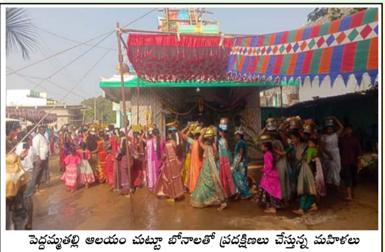
పెద్దమ్మతల్లి ఆలయం చుట్టూ బోలెలతో ప్రదక్షిణలు చేస్తున్న మహిళలు