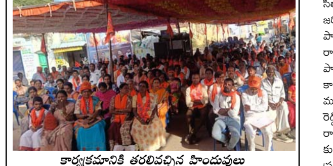
కార్యక్రమానికి తరలివచ్చిన హిందువులు