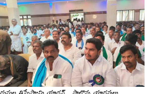
అగళి మండల కేంద్రం నుంచి తరలివెళ్లిన యాదవులు