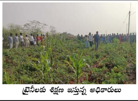
వైసీపీలకు శిక్షణ ఇస్తున్న అధికారులు