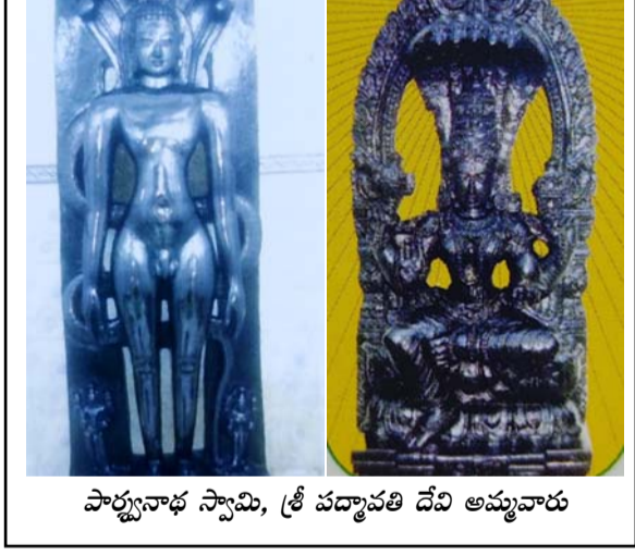
పార్వినాథ్ స్వామి, శ్రీ వద్దావతి దేవి అమ్మవారు