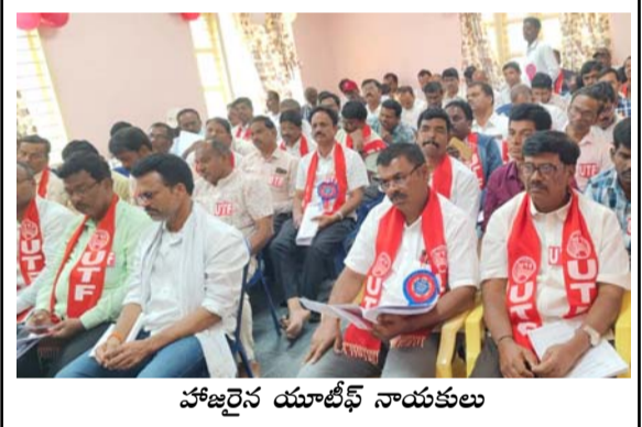
హాజరైన యూటీఎఫ్ నాయకులు