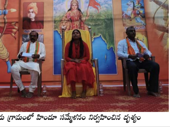
గుడిపాడు గ్రామంలో హిందూ సమైక్యం నిర్వహించిన దృశ్యం

సందర్భంగా చిన్న సింగన పల్లె, గుడిపాడు గ్రామాలకు చెందిన కోలాట బృందాలు చేసిన ప్రదర్శనలు భక్తులను, గ్రామస్థులను విశేషంగా ఆకట్టుకున్నాయి. ఈ సమైక్యనానికి మట్టుపక్కల గ్రామాల నుండి హిందూ సోదరులు, భక్తులు భారీ సంఖ్యలో తరలివచ్చారు. రామాలయ ప్రాంగణం భక్తి గీతాలు, జై శ్రీరామ్ నినాదాలతో మారుమోగింది. కార్యక్రమంలో స్థానిక పెద్దలు, యువకులు, ఆశ్రమ నిర్వాహకులు పాల్గొన్నారు.