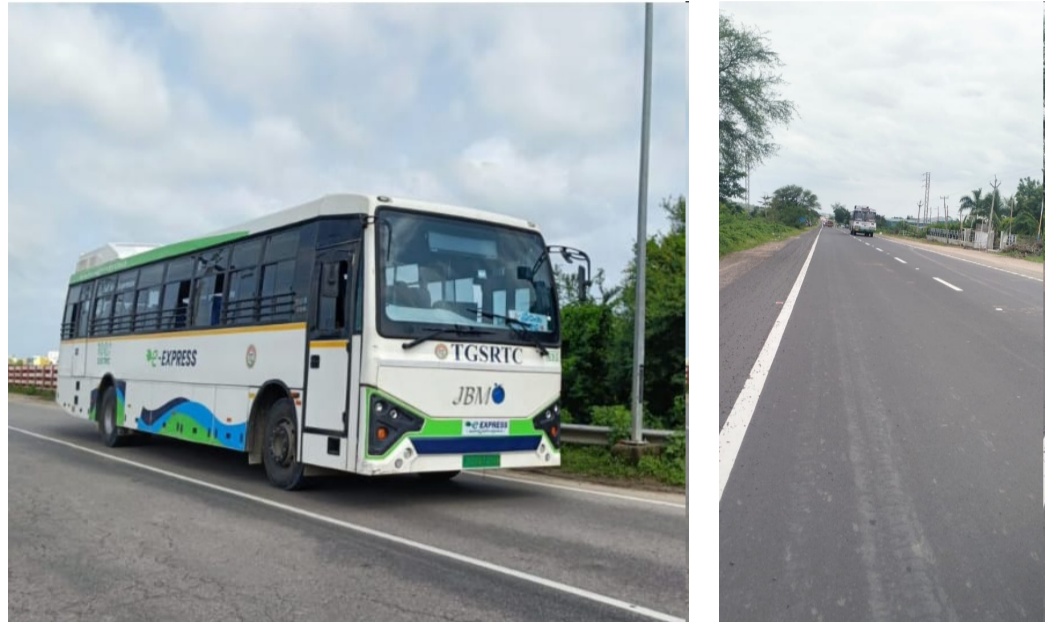
బైకును ఢీ కొట్టిన బస్సు నిర్వహించిన జూలై 28 అమృత్ తెలంగాణ బైంసా నుండి బాసర వరకు వెళ్లే ప్రధాన జాతీయ రహదారిపై వాహనాలు యాక్సిడెంట్ల రూపంలో రోజురోజు ప్రమాదం జరుగుతూ రోడ్డుపై వెళ్తున్న వారి ప్రాణాలు గాలిలో కలిసిపోవడం సర్వ సాధారణమైపోయింది ఒక ప్రమాదం జరిగి మృతిపోకముందే మరుసటి రోజు మరొక మృత్యువుల రహదారి పైన చోటు చేసుకుంటుంది వాహనదారులు ఆ మార్గం గుండా ప్రయాణించాలంటే తమ ప్రాణాలను గుప్పిట్లో పెట్టుకుని ప్రయాణించాల్సిందే అన్న రీతిలో తీవ్ర ఆందోళనలకు గురిచేస్తుంది వరుసగా గత వారం రోజుల వ్యవధిలోని ఐదుగురు ఈ రోడ్డుపై రోడ్డు ప్రమాదంలో తమ ప్రాణాలను కోల్పోవడం జరిగింది ఈ రోడ్డు ప్రాంతంపై నుండి ఇప్పటిదాకా జరిగినటువంటి రోడ్డు ప్రమాదాలు ఎన్నో అని చెప్పుకోవాలి రోడ్డు నిర్మాణ కాంట్రాక్టర్ల సరైన చర్యలు తీసుకోకపోవడంతో వరుసగా రోడ్డు ప్రమాదాలు జరుగుతున్నాయని కలర్బస్ ట్రిబ్యూనల్ పై నుండి తండ్రి కూతురు రోడ్డు ప్రమాదానికి గురై ట్రిబ్యూనల్ కింద పడడంతో తండ్రి అక్కడికక్కడే మృతి చెంది కూతురు కాల్చి ఇరిగి పోవడం జరిగింది అమె బైంసా ప్రభుత్వ ఆస్పత్రిలో వైద్యం పొందుతుంది అది మరవకముందే సోమవారం ముద్గోల్ ఆశ్రమ పాఠశాల వ్యాయామ ఉపాధ్యాయుడు ఆడే నరేష్ 45 ఆయన ప్రయాణిస్తున్న బైకును బస్సు ఢీకొనడంతో అక్కడికక్కడే మృతి చెందిన జరిగింది ప్రతిరోజు ఏదో ఒక ప్రమాదం జరుగుతూనే ఉంది ప్రమాదాలు జరిగి ఇద్దరినీ బలిగొన్న సంఘటన తీవ్ర ప్రాంతానికి గురిచేస్తుంది ఇలాగ కొనసాగితే ఆ రోడ్డుపై ప్రయాణం సాగించాలంటే వాహనదారులు తీవ్ర భయాందోళన చెందుతున్నారు వరుస ప్రమాదాలకు రోడ్డు పనులు పూర్తి కాక పోవడమే కారణమని

బైంసా నుండి బాసర రోడ్డుపై వెళ్ళాలంటే ఏ ప్రమాదం ఎప్పుడు ముంచుకొస్తుందోనని భయంతో భయంతో రోడ్డుపై వెళ్తున్న వాహనదారులు కాంట్రాక్టర్ల నైన జాగ్రత్తలు తీసుకోకపోవడంతోనే ఇటువంటి ప్రమాదాలు జరుగుతున్నాయని కలర్బస్ నిర్మాణం వద్ద సరైన రోడ్డు సూచికలు ఏర్పాటు చేసి ప్రమాదాలు జరగకుండా చూడాలని ప్రజలు ప్రయాణికులు సంబంధిత అధికారులను వేడుకుంటున్నారని సంబంధిత అధికారులు ఇప్పటికే కాంట్రాక్టర్లు మందలిని తగు జాగ్రత్తలు తీసుకునే విధంగా చూడాలని ప్రమాదాలను నివారించాలని కోరుతున్నారు