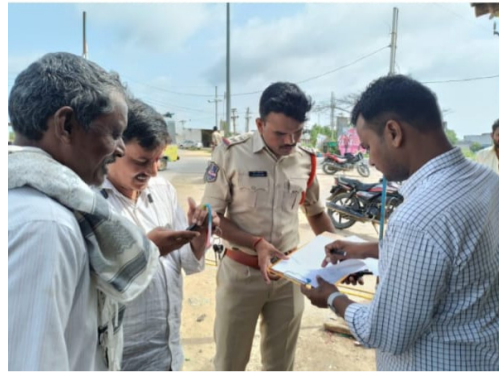
ప్రమాదం జరిగిన సంఘటన స్థలాన్ని పరిశీలిస్తున్న పోలీసులు