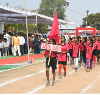
అధికారులకు ప్రజా ప్రతినిధులకు సమస్యారం చేస్తున్న విద్యార్థులు