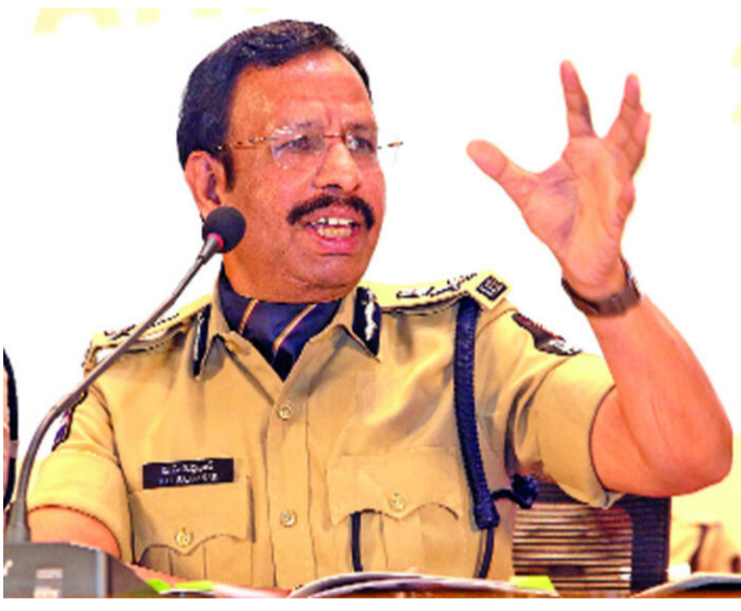
కేసులు నమోదుకాగా, 2,690 మంది నిందితులను అరెస్టు చేసినట్లు తెలిపారు.

హైదరాబాద్: అమ్మత్ తెలంగాణ: నేర నియంత్రణలో అత్యాధునిక టెక్నాలజీతో మెరుగైన ఫలితాలు సాధించామని, గతేడాదితో పోలిస్తే ఈ ఏడాది 15శాతం నేరాలు తగ్గాయని హైదరాబాద్ సీపీ విసి.సజ్జనార్ తెలిపారు. గతేడాదితో పోలిస్తే మహిళలు, చిన్నారులపై మాత్రం నేరాలు పెరిగాయన్నారు. హైదరాబాద్ బంజారాహిల్స్ లోని ఐసీసీసీలో శనివారం విలేజరుల సమావేశంలో 2025 వార్షిక నేర నివేదికను సీపీ విడుదల చేశారు. ఈ సందర్భంగా సీపీ మాట్లాడుతూ.. మార్కెట్ ప్రాంతాలు, సీపీ వస్తువులు, విత్తనాల నియంత్రణపై డీసీపీ స్థాయి అధికారి పర్యవేక్షణలో ప్రత్యేక టీమ్స్ను ఏర్పాటు చేస్తామన్నారు. రానున్న రోజుల్లో నార్మల్ టీమ్స్ను మరింత బలోపేతం చేస్తామని తెలిపారు. దేశంలోనే తెలంగాణ పోలీసులు నెంబర్ వన్ స్థాయిలో ఉన్నారని, గతంలో పోలీస్ నగరంలో లా అండ్ ఆర్డర్ బాగుందని, క్రైమ్ రేట్ అదుపులో ఉందని తెలిపారు. నగర పోలీసులు ఎప్పుడూ ప్రజలకు అందుబాటులో ఉంటారని, ఏ ఆపద వచ్చినా దయలో 100కు ఫోన్ చేయాలని కోరారు. అత్యాశకుపోయి నగరవాసులు సైబర్ నేరాలలో చిక్కుకుంటున్నారని, వాటిపై ప్రజల్లో విస్తృత అవగాహన కల్పిస్తున్నామని చెప్పారు. నగర వ్యాప్తంగా 5లక్షల 20 వేల సీసీ కెమెరాలను వినియోగిస్తున్నామన్నారు.