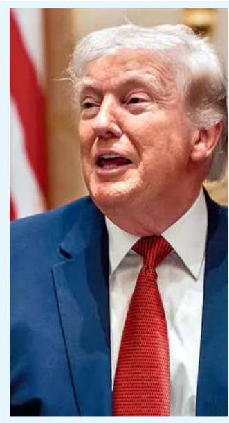
అమెరికా కరెన్సీ నోట్లపై ట్రంప్ సంతకం

జరిపించే వైదికులు స్పందించారు. కన్యావరణం సందర్భంగా గోత్రాలు పెప్పే విషయంలో శ్రీరాముడికి నారాయణుడి గోత్రమైన అక్షయ గోత్రాన్ని, సీతమ్మ వారికి లక్ష్మీదేవి గోత్రమైన సౌభాగ్య గోత్రాన్ని చెప్పారు. రామదాసు కాలం నుంచి ఇవే గోత్రాలు చెబుతున్నారని, ఇకపై కూడా ఇవే గోత్రాలను చదువుతామని, ఇందులో మార్పు ఉండబోదని స్పష్టం చేశారు. రూ.351 కోట్లతో అభివృద్ధి పనులు ఉదయం 10-45 గంటలకు సారపాక లోని హెలిపాప్ డి.సి.ఎం చేరుకున్నారు. అక్కడి నుంచి నేరుగా భద్రాచలం ఆలయానికి చేరుకుని దైవదర్శనం చేసుకున్నారు. ఆ తర్వాత రూ.351 కోట్లతో చేపట్టే అలయ విస్తరణ, పునరుద్ధరణ, పుష్కరపూజా విస్తరణ, మౌలిక సదుపాయాల కల్యాణ పనులకు భూమి పూజా నిర్వహించారు. వచ్చే పుష్యం నాటికి పనులు పూర్తి చేస్తామని మంత్రి కొండా సురేఖ ఈ సందర్భంగా చెప్పారు. సీఎం రాక సందర్భంగా పోలీసులు ఆక్రమణ విధించడంతో భక్తులు ఇబ్బంది పడ్డారు. నిలువ నిడ, మంచినీటి కోసం నేడు పట్టణ వికాసిని గవర్నర్ కల్యాణం ముగిసిన మరునాటి రోజు భద్రాచలం లలో శ్రీరాముడికి పట్టణ వికాసిని జరిపించడం ఆనవాలుగా పనిస్తోంది. ఈ మేరకు శనివారం జరిగే వేడుకకు గవర్నర్ శివప్రతాప్ శుక్లా ముఖ్యఅతిథిగా రానున్నారు. ఇందుకోసం మిడిలా స్టేడియంలో దేవదాసు శాఖ ఏర్పాటు పూర్తి చేసింది.