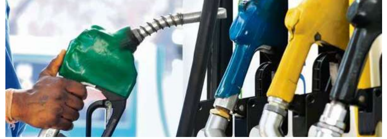
ఈ మేరకు కేంద్ర ఆర్థిక శాఖ గురువారం ఆర్థికాన్ని నోటిఫికేషన్ విడుదల చేసింది. తాజా నిర్ణ

యంతో లిటర్ పెట్రోల్ పై విధిస్తున్న ఎక్సైజ్ సుంకం రూ.21.90 నుంచి రూ.11.90కి తగ్గింది. డీజిల్ పై ధరల తగ్గణమే తగ్గే అవకాశం లేకపోయినా ఇంధన ధరల భారాన్ని చమురు కంపెనీలు ప్రజల పైకి బదిలీ చేయకుండా ఉపకరించనుంది. గుతాయే, ఎక్సైజ్ సుంకం తగ్గించే వల్ల కేంద్రానికి రూ.1.75 లక్షల కోట్ల మేర ఆదాయం తగ్గిపోతుందని అధికార వర్గాలు తెలిపాయి. ఇరాన్ పై వెమెరికాణాజా యేల్ దాడులు ప్రారంభమైనప్పటి నుంచి అంతర్జాతీయ చమురు ధరలు దాదాపు 50 శాతం పెరిగాయి. ఆయనప్పటికీ, దేశంలోని ప్రభుత్వ రంగ సంస్థలైన ఆయిల్ కంపెనీ, బీపీఎస్ఎల్, ఐపీఎస్ఎల్ ధరలను పెంచకుండా స్థిరంగా ఉంచాయి. దీనివల్ల ఆయా సంస్థలు తీవ్ర నష్టాలను ఎదుర్కొంటున్నాయి. ఈ