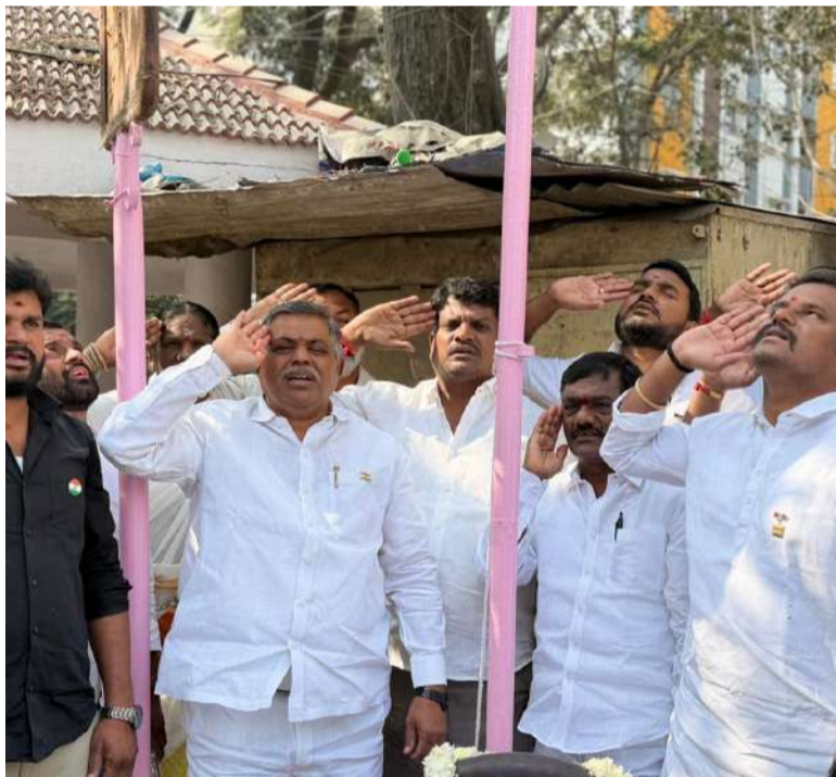
జాతీయ జెండాకు వందనం సమర్పిస్తున్న ద్విశ్యం

గచ్చిబౌలి బీఆర్ఎస్ అధ్యక్షులలో గణతంత్ర దినోత్సవ వేడుకలు