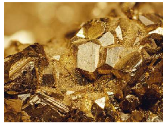
బంగారు కొండ మరింత ఎత్తుకు >> 4లో