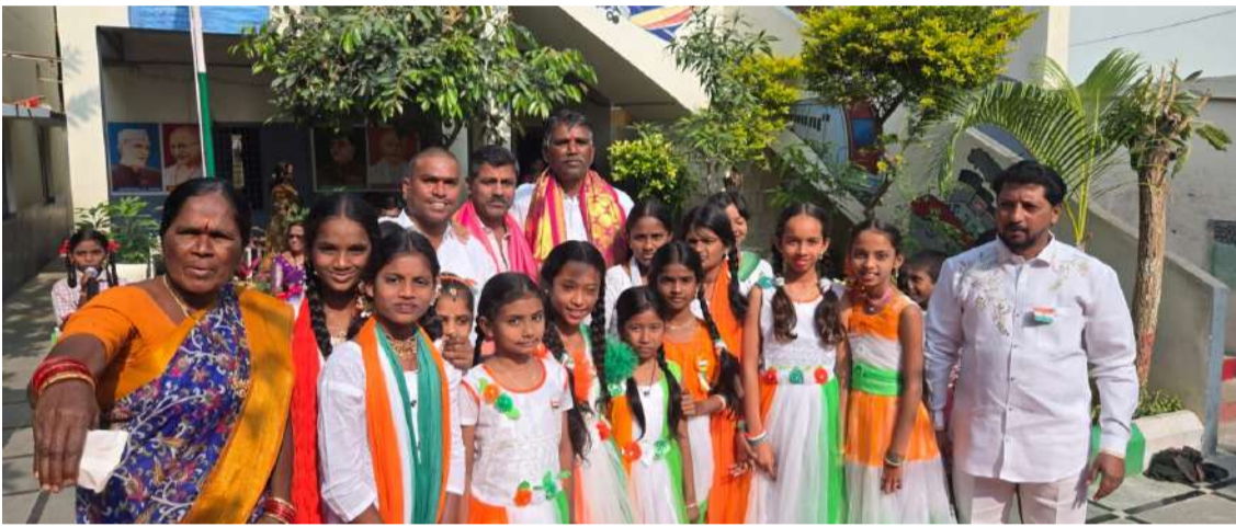
గణతంత్ర దినోత్సవ వేడుకల్లో విద్యార్థులతో కలిసి ఆంజనేయులు తదితరులు