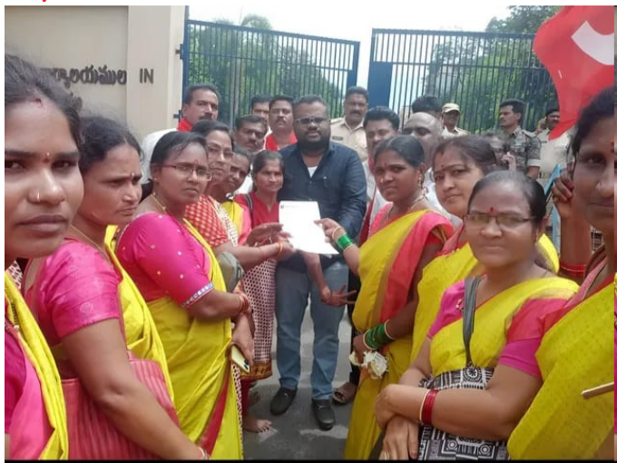
వినతి పత్రం సమర్పిస్తున్న అంగన్వాడీ టీచర్లు