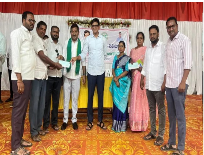
చెక్కలు అందజేస్తున్న ఎమ్మెల్యే కల్యాణకుంట్ల సంజయ్

మేట్ పల్లి అమృత్ తెలంగాణ అగస్టు 23 కోర్టుల ఎమ్మెల్యే డా.కల్యాణకుంట్ల సంజయ్ మేట్ పల్లిలో కళ్యాణ లక్ష్మి, ఫాది ముబారక్ పథకాల కింద 130 మంది లబ్ధిదారులకు రూ. 1,30,15,080 విలువైన చెక్కలను శనివారం పంపిణీ చేశారు. ఈ సందర్భంగా ఆయన కాంగ్రెస్ ప్రభుత్వం ప్రజా సమస్యల పరిష్కారంలో విఫలమైందని, వారి పాలనలో రాష్ట్రం వెనుకబడిపోయిందని విమర్శించారు. కరోనా సమయంలోనూ కోఆర్డినేషన్ అందించారని, సీఎం రేవంత్ రెడ్డి ఇచ్చిన హామీలను నెరవేర్చడం లేదని, ప్రజలు కాంగ్రెస్ ప్రభుత్వంపై నమ్మకం కోల్పోయారని, వచ్చే ఎన్నికల్లో బీఆర్ఎస్ ను ఆదరించాలని ఆయన కోరారు. కార్యక్రమంలో బిఆర్ఎస్ నాయకులు, లబ్ధిదారులు పాల్గొన్నారు.