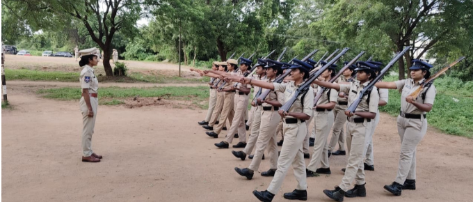
మంచిన్యాల కొమురం భీం జిల్లా నిజాంబాద్ జిల్లా కఠినంగర్ జిల్లా వార్డులు పెట్టండి