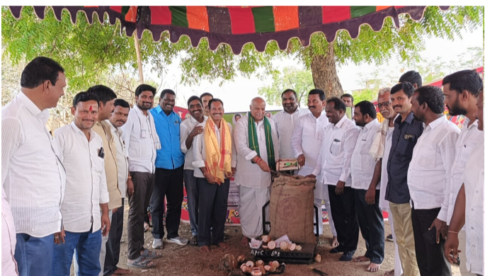
కుంటలలో జొన్నల కొనుగోలు కేంద్రం ప్రారంభించిన ఎమ్మెల్యే

రైతులకు కావాల్సిన సలహాలు సూచనలు ఎప్పటికప్పుడు అందించడానికి రాష్ట్ర ప్రభుత్వం మరియు వ్యవసాయ శాఖ సిద్ధంగా ఉందని రైతులు రాష్ట్ర ప్రభుత్వం ఇప్పుడు సలహాలు సూచనలు పర్యాటకీ తీసుకొని వ్యవసాయ రంగంలో రాష్ట్ర రైతంగం ముందుకు సాగాలని కోరారు. ఈ సందర్భంగా తెలంగాణ రాష్ట్ర ముఖ్యమంత్రి ఎనుముల రేవంత్ రెడ్డి కి మరియు వ్యవసాయ మరియు మార్కెటింగ్ శాఖ మంత్రివర్యులు తుమ్మల నాగేశ్వరరావు కు జిల్లా ఇన్చార్జ్ మంత్రి సీతక్క కు ధన్యవాదాలు తెలిపారు. ఈ కార్యక్రమంలో సానైటి చైర్మన్ మరియు డైరెక్టర్ల తదితరులు పాల్గొన్నారు.