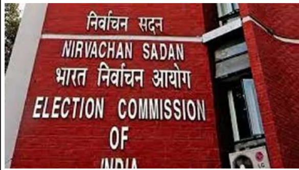
చాలా రాష్ట్రాల్లో సగం మందికిపైగా ఓటర్లు ఎన్ఐఆర్ కు పత్రాలు ఇవ్వవలసిన సమయం లేదు >> 2లో

మధ్యతరగతికి ఉపశమనం కల్పించేలా జీఎస్టీ సుస్కరణలు: నిర్మలా సీతారామన్ >> 4లో