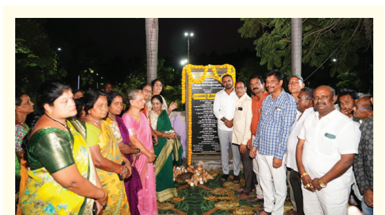
ఆరోగ్యకరమైన రాజమహేంద్రవరం లక్ష్యంగా