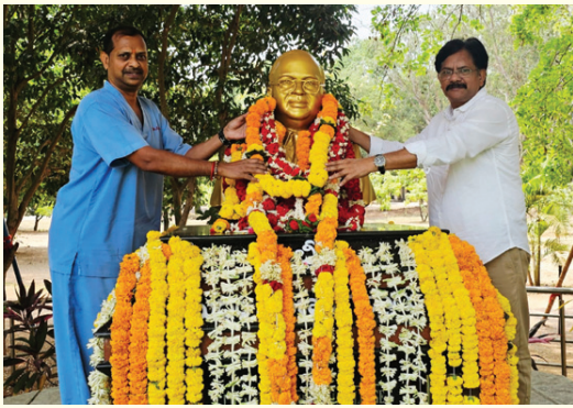
భారత రాజ్యాంగ పితామహుడు