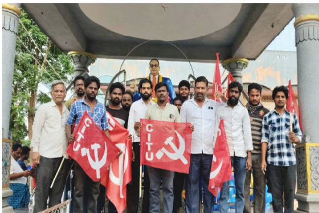
అంబేద్కర్ కార్మిక శాఖ, న్యాయ శాఖ మంత్రిగా పనిచేసిన కాలంలో కార్మికులకు 8 గంటల పని విధానం, కనీస వేతనం, సమాన పనికి సమాన