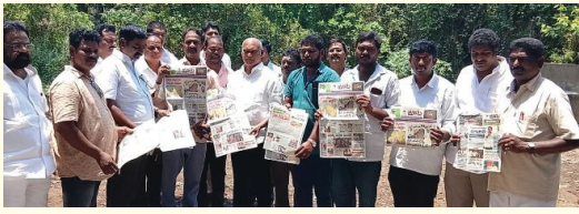
పాఠకుల మన్ననలు పొందిన