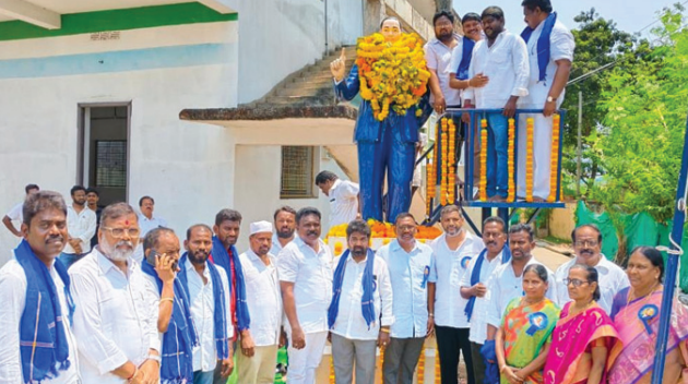
వద్ద ఏర్పాటుచేసిన అంబేద్కర్ విగ్రహానికి పూలమాలలు వేసి నివాళులర్పించారు. అనంతరం