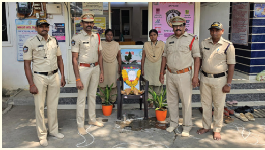
భీమవరం వన్ టౌన్ పోలీస్ స్టేషన్లో