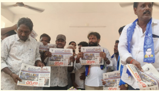
రాష్ట్ర కార్మిక శాఖ మంత్రి వాసంకెట్టి సుభాష్ చేతుల మీదుగా మనసులో మాట దినపత్రిక ఆవిష్కరిస్తున్న దృశ్యం

- నగరంలో 2000 బైక్లతో భారీ ర్యాలీ - రెల్లిపేటలో అంబేద్కర్... జోగేంద్రనాథ్ మండల్ రెడ్డి విగ్రహాలు ఆవిష్కరణ