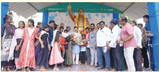
డా.బి.ఆర్. అంబేద్కర్ 135వ.జయంతి వేడుకల్లో