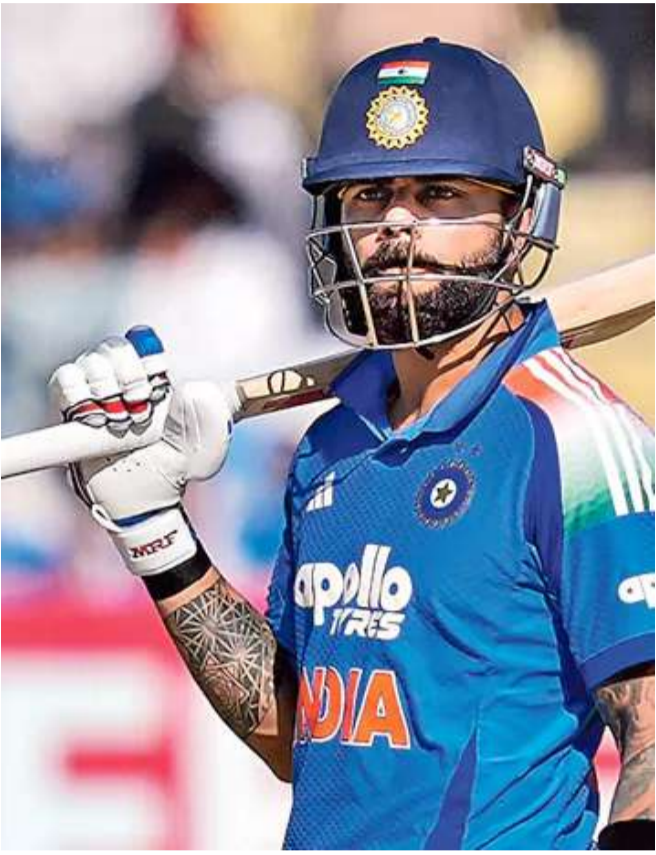
మూడో స్థానానికి రోహిత్

దుబాయ్: అయ్యత ఫామ్లో ఉన్న స్ట్రాక్ బ్యాటర్ విరాట్ కోహ్లా సుదీర్ఘ విరామం తర్వాత సంబరపన్ ర్యాంకును కైవసం చేసుకున్నాడు. న్యూజిలాండ్తో తొలి వన్డే అదరగొట్టిన అతడు రోహిత్ను వెనక్కి నెట్టి వన్డే బ్యాటర్ ర్యాంకింగ్లో అగ్రస్థానానికి చేరుకున్నాడు. ఈ ఘనత సాధించడం అయిదేళ్లలో అతడికి ఇదే తొలిసారి. చివరిగా కోహ్లా 2021 జులైలో సంబరపన్ స్థానంలో ఉన్నాడు. మొత్తంగా ఈ స్థానంలో అతడు 825 రోజులు పూర్తి చేసుకున్నాడు. కెరీర్లో అగ్రస్థానం చేరుకోవడం అతడికి ఇది పదకొండోసారి. తాజా ర్యాంకింగ్లో కోహ్లా 3 బ్యాటర్ల మధ్య అంతరం పెద్దగా లేదు. కోహ్లా (785), రెండో స్థానంలోని డబ్లిల్ మిచెల్ (784) మధ్య తేడా ఒక పావుంటే. రోహిత్