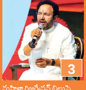
మహిళా రిజర్వేషన్ బిల్లుపై రాజకీయం వద్దు

అదరగొట్టిన ప్రపుల్, సకివ్ ఇఫాన్ కెస్టన్ ఇన్ఫర్మ్స్ రాజస్థాన్ పై హైదరాబాద్ ఘనవిజయం .1/0.. 2/1.. 3/1.. 4/2.. 5/9.. రాజస్థాన్ రాయల్స్ పతనం సాగిన తీరింది. ఈ గణాంకాల్ని బట్టి చెప్పేయొచ్చు.. ఆ జట్టు ఎంతగా ఉక్కిరిబిక్కిరి అయిందో! ఈ విషయంలో చరుసగా నాలుగు విజయాలతో జైత్రయాత్ర.. పాయింట్లు పట్టకపోతే లగ్నానం.. దుర్భేద్యమైన బ్యాటింగ్ తో ఎవరికీ లండనంత ఎత్తులో నిలిచిన రాజస్థాన్ కు కొత్త కుర్రాళ్లు నేలకు దించేశారు. పేలవ బౌలింగ్ తో సతమతమవుతున్న సన్ రైజర్స్ కు గొప్ప ఉపశమనాన్ని ఇస్తూ విదర్బ ఎక్స్ ప్రెస్ ప్రపుల్ హింగ్ (4/34)..