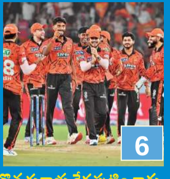
కొత్త కుర్రాళ్లు కేక వుట్టించారు

అదరగొట్టిన ప్రపుల్, సకివ్ ఇఫాన్ కెస్టన్ ఇన్ఫర్మ్స్ రాజస్థాన్ పై హైదరాబాద్ ఘనవిజయం .1/0.. 2/1.. 3/1.. 4/2.. 5/9.. రాజస్థాన్ రాయల్స్ పతనం సాగిన తీరింది. ఈ గణాంకాల్ని బట్టి చెప్పేయొచ్చు.. ఆ జట్టు ఎంతగా ఉక్కిరిబిక్కిరి అయిందో! ఈ విషయంలో చరుసగా నాలుగు విజయాలతో జైత్రయాత్ర.. పాయింట్లు పట్టకపోతే లగ్నానం.. దుర్భేద్యమైన బ్యాటింగ్ తో ఎవరికీ లండనంత ఎత్తులో నిలిచిన రాజస్థాన్ కు కొత్త కుర్రాళ్లు నేలకు దించేశారు. పేలవ బౌలింగ్ తో సతమతమవుతున్న సన్ రైజర్స్ కు గొప్ప ఉపశమనాన్ని ఇస్తూ విదర్బ ఎక్స్ ప్రెస్ ప్రపుల్ హింగ్ (4/34)..