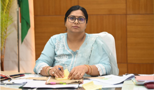
నిర్మల్ జిల్లా కలెక్టర్ అభిలాష అభినవ్