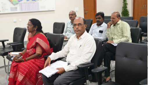
సమావేశంగా హాజరైన జిల్లా అధికారులు

అమృత్ తెలంగాణ నిర్మల్ ప్రతినిధి శుక్రవారం సాయంత్రం కలెక్టరేట్లోని తన చాంబర్లో గ్రామీణాభివృద్ధి, పంచాయతీరాజ్ శాఖల పనుల పురోగతిని సమీక్షించిన కలెక్టర్, అంగన్వాడీ భవనాలు, పాఠశాలల మరుగుదొడ్లు, ఉపాధి హామీ నిధుల ద్వారా చేపట్టిన పనులపై అధికారుల నుంచి వివరాలు తెలుసుకున్నారు. ఈ సందర్భంగా కలెక్టర్ మాట్లాడుతూ,