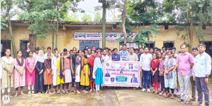
మత్తు పదార్థాలపై విద్యార్థులకు అవగాహన కార్యక్రమం