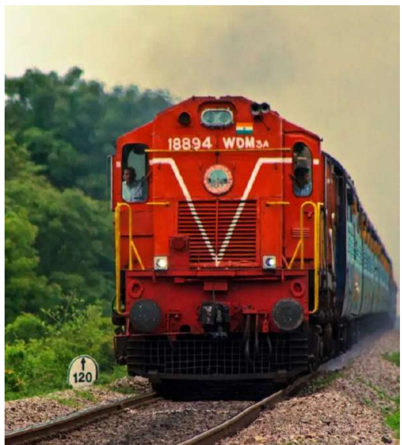
అయితే, టికెట్ రద్దు అయ్యే అవకాశం ఉంది. కాబట్టి అవసరం. ఈ విషయాన్ని వినియోగదారులు తప్ప ప్రయాణ ప్రణాళికను జాగ్రత్తగా నిర్దేశించుకోవడం కుండా గమనించాల్సి ఉంటుంది.

ప్రయాణికుల అవసరాలను దృష్టిలో పెట్టుకుని ఇండియన్ రైల్వే ఒక కీలక మార్పు ప్రవేశపెట్టింది. చివరి నిమిషంలో ప్రయాణానికి సంబంధించిన బోర్డింగ్ స్పేషన్ మార్పుకోవాలనుకునే వారికి ఇది చాలా ఉపయోగకరంగా ఉంటుంది.