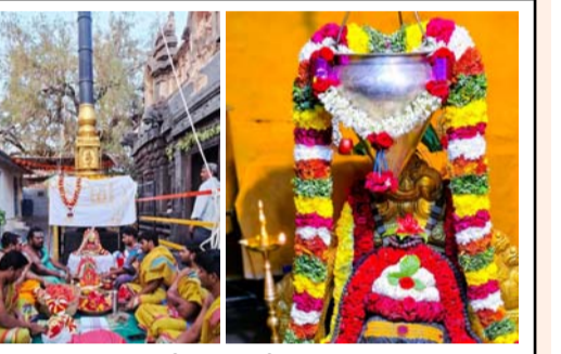
ద్వజారోహణం చేస్తున్న దుశ్యం ప్రత్యేక అలంకరణలో శ్రీ బుగ్గ రామలింగేశ్వర స్వామి

బుధవారం రెండవ రోజున ఆలయ అర్చకులు ద్వజారోహణం, చిత్రగోపురసేవ కార్యక్రమాలు నిర్వహించారు. ఆలయ ప్రాంగణంలో ప్రాముఖ్యతపై భాగంగా అగ్రముఖం, మహాగణపతి హోమం చేపట్టారు. అనంతరం స్వామి వారికి అలంకరణ గావించి, వివిధ పూజలు చేసి భక్తులకు దర్శనాగ్రంథం కల్పించారు.