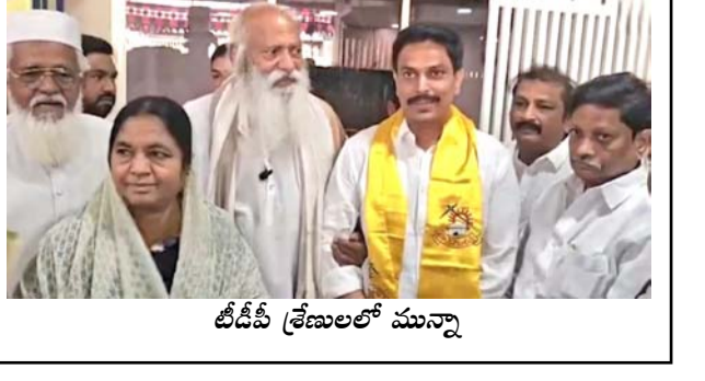
డి.డి.పి. కేబుల్లో మున్నూ