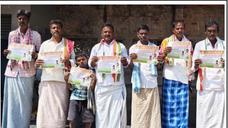
ఉపాధి హామీ పథకం పరిరక్షణ యాత్ర పోస్టర్ విడుదల చేస్తున్న కాంగ్రెస్ పార్టీ నాయకులు