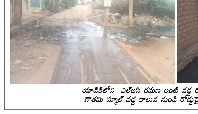
యా.డి.పి.లోని ఎల్.ఐ.సి. రమణ ఇంటి వద్ద రోడ్డుపై నిలిచిన మురికి నీరు. గౌతమి సూర్యోదయ మండల రోడ్డుపై పారుతున్న మురికి నీరు