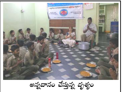
అన్నదానం చేస్తున్న దుశ్యం