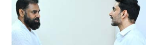
అమరావతి (తెలుగోడు), ఫిబ్రవరి 11 :

అసెంబ్లీలో డిప్యూటీ సీఎం పవన్ కళ్యాణ్ తో విద్య, బడి శాఖల మంత్రి నారా లోకేష్ సమావేశమయ్యారు. అసెంబ్లీలో పవన్ కళ్యాణ్ ఛాబెరీకు వెళ్లిన లోకేష్ తాజా రాజకీయ పరిణామాలపై చర్చించారు. అదేవిధంగా బడ్జెట్ సమావేశాల్లో చర్చించాలని అంశాలపై ఇరువురి మధ్య చర్చ జరిగినట్లు సమాచారం.