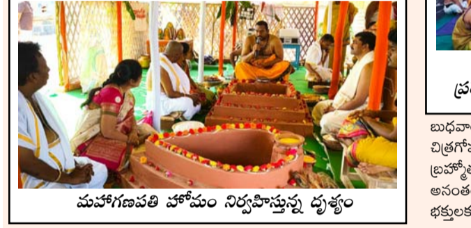
మహాశివరాత్రి హోమం నిర్వహిస్తున్న దుశ్యం

తాడిపత్రి (ఆటోగోష), ఫిబ్రవరి 11 : పెన్నా నది పరివాహక ప్రాంతంలో వెలిసిన శ్రీ బుగ్గ రామలింగేశ్వర స్వామి దేవస్థానంలో మహాశివరాత్రి ప్రాముఖ్యతపై భాగంగా