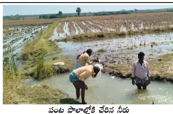
పంట పొలాల్లోకి చేరిన నీరు

హౌస్ ఎయిర్ వాల్ ఏర్పాటు చేయకముందు ఎకరాకు 40 ఏసెల దిగుబడి వచ్చేదని , వాల్ ఏర్పాటు చేసిన తర్వాత లీకేజ్ నీటితో లోపల ఉన్న పంపు మట్టి , సాగు కొల్లకు వచ్చి పొలాల్లో వడలం వల్ల పంట నష్టం జరిగి ఎకరాకు 20 నంచులు మాత్రమే దిగుబడి వస్తుందని తెలిపారు. ఈ విషయంపై అధికారులకు పలుమార్లు ఫిర్యాదు చేసిన పట్టించుకోవడం లేదని ఆగ్రహం వ్యక్తం చేశారు. రైతులు ఫిర్యాదు చేసినప్పటికీ తామ మంత్రంగా పనులు చేసి చేతులు దులుపుకుంటున్నారన్నారు. తుంగభద్ర నది నుండి నీరు పంపింగ్ చేసే క్రమంలో పులికనుమ రిజర్వాయర్ వెళ్ళాల్సిన నీరు పూర్తిగా 40 ఎకర వరకు ఇక్కడే లీకేజ్ అవుతుందన్నారు. అధికారులు స్పందించి పూర్తిస్థాయి మరమ్మత్తులు చేసి లీకేజ్ నీరు పొలాల్లో రాకుండా చేయాలని రైతులు కోరుతున్నారు. లేనిపక్షంలో పంట నష్టం అయినా రైతులకు నష్టపరిహారం చెల్లించాలని కోరారు.