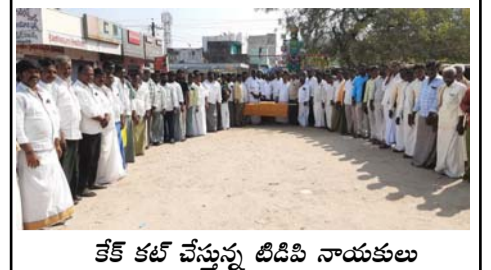
కేకే కల్ చేస్తున్న టీడీపీ నాయకులు