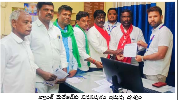
బ్యాంక్ మేనేజర్లకు వినతిపత్రం ఇస్తున్న దృశ్యం