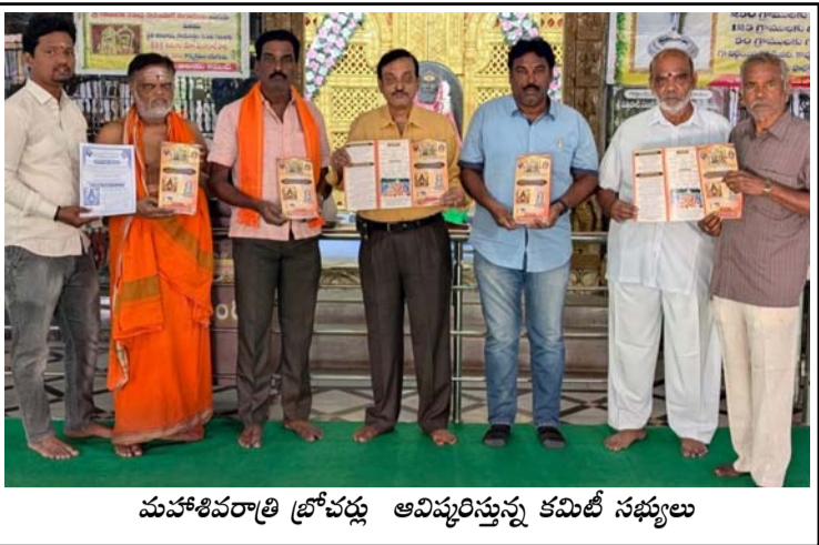
మహాశివరాత్రి ప్రోచడ్ర ఆవిష్కరణ కమిటీ సభ్యులు