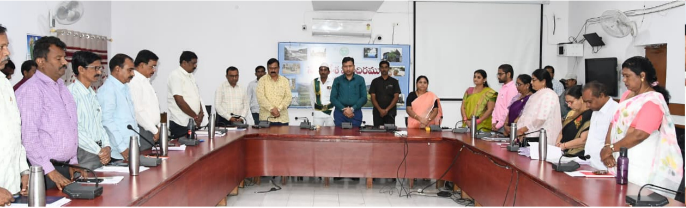
కవి అంద్రేజ్ మరణ వార్తపై మానవ పాటిస్తున్న జిల్లా కలెక్టర్ మరియు జిల్లా అధికారులు