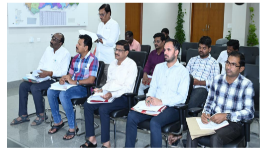
సమావేశం హాజరైన మున్సిపల్ అధికారులు మరియు పంచాయతీ రాజ్ అధికారులు

అమృత్ తెలంగాణ నిర్మల్ ప్రతినీధి సోమవారం రాత్రి కలెక్టరేట్ లోని సమావేశ మందిరంలో జిల్లా పరిషత్, గ్రామ పంచాయతీ, మున్సిపల్ శాఖల అధికారులతో సమావేశం నిర్వహించారు. ఈ సందర్భంగా కలెక్టర్ మాట్లాడుతూ, ఆయా శాఖలకు వివిధ రూపాల్లో ప్రభుత్వం అందించే గిద్దులు, స్టానికంగా.. ఆర్డెలు, వివిధ పన్నులు, నిర్మాణ అనుమతుల ఫీజులు, లైసెన్సు ఫీజులు, నిర్మాణ అనుమతుల ఫీజులు, సంతలు, లే అవుట్లు, రిజిస్ట్రేషన్ లు, తదితర రూపాల్లో