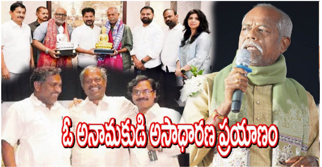
ఓ అనామకుడి అసాధారణ ప్రయాణం

పైరగాలిలో, పక్షుల గుంపులో, వాన చినుకులో, కొండవాగులో, మట్టి వానలో పుట్టిన సహజమైన కవిత్వం అందెలో సొంతం. ఆయన పాటలు జన బాహుళ్యాన్ని చైతన్యపరుస్తాయి, హృదయాలనూ ప్రవీణిస్తాయి. గౌరెల కాపరిగా పని చేసినా, తాపీ పని చేసినా.. ప్రకృతిని బడిగా మల్గులకు అసాధారణ ప్రజ్ఞాశాలి. చిన్ననాటి నుంచి ఆధ్యాత్మిక ప్రపంచంతో మమేకమైన అందెలో ఎన్నో భక్తి పాటలు, పద్యాలూ పాడారు.