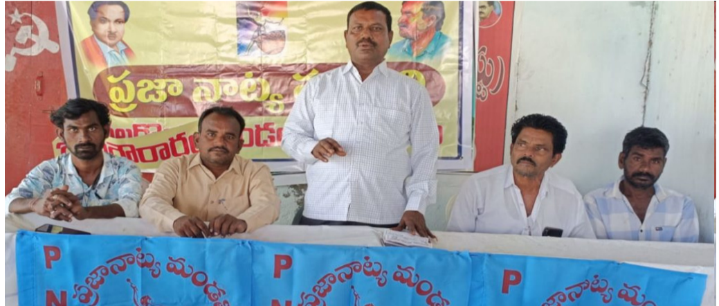
నకిలేకల్ : అమృత్ తెలంగాణ: సాంప్రదాయ కళల పరిరక్షణకు ప్రభుత్వాలు కృషి చేయాలని ప్రజానాట్యమండలి జిల్లా ప్రధాన కార్యదర్శి కుమార్తె శంకర్ కోరారు. సోమవారం సమావేశం జరిగింది. ఈ సందర్భంగా ఆయన మాట్లాడుతూ.. ప్రపంచంలో ప్రాచీన నాగరికతగా పేరుగాంచిన భారతీయ సంస్కృతిని నేటి విప సంస్కృతి కబళిస్తోందన్నారు. వృత్తి సాంప్రదాయాలు, జానపద కళారూపాలు క్రమంగా అంతరించిపోతున్నాయన్నారు. ఈ కళల ఆధారంగా బతుకుతున్న అనేక కుటుంబాలు దిక్కుతోచని పరిస్థితిలో ఉ