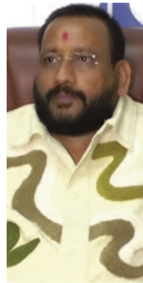
తెలుగు పత్రికా రంగంలో ఒక గొప్ప అక్షర విప్లవానికి..

అదే సమయంలో ఎలక్ట్రానిక్ మీడియా రంగంలో మున్నెన్నడూ కనీవీని ఎరుగని సాంకేతిక విప్లవానికి..