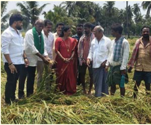
అకాల వర్షాలతో దెబ్బతిన్న రైతులను