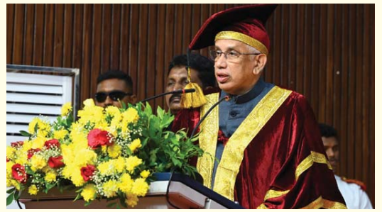
వికసిత భారత్ లక్ష్య సాధనలో