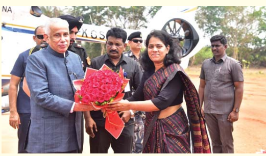
గైట్ ఇంజనీరింగ్ కాలేజీ హెలిప్యాడ్ వద్ద