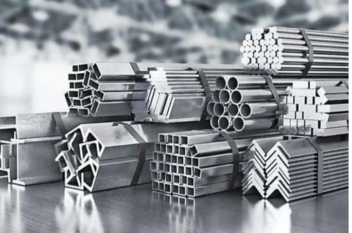
దిల్లీ: పశ్చిమాసియా సంక్షోభం వల్ల, సరఫరా అంతరాయాలు కలుగుతాయన్న భయాల మధ్య అంతర్జాతీయంగా అల్యూమినియం ధరలు పెరుగుతున్నాయి. ప్రస్తుతం టన్ను ధర 3400 డాలర్లకు చేరింది. స్వల్పకాలంలో భారత ఉత్పత్తిదారులకు ఈ ధరలు ప్రయోజనాన్ని అందించినా, దీర్ఘకాలంలో

ముడిపదార్థాల వ్యయాల రూపంలో సవాళ్లు వినవోచ్చని భారతీయ ఖనిజ పరిశ్రమల సంఘం (ఐఐఐఎ) అంటోంది. పశ్చిమాసియాలోని కొన్ని అల్యూమినియం నిల్వ ఉత్పత్తి నిలిపివేసి, ఎగుమతులను తాత్కాలికంగా ఆపేశాయి. ఖాతాలోని ఖాతామే స్ట్రెయిన్ పట్టడం ప్రకటించింది. ప్రపంచవ్యాప్త అల్యూమినియం ఉత్పత్తిలో దాదాపు 89% పశ్చిమాసియా నుంచే వస్తోందని ఐఐఐఎ పేర్కొంది. హర్యాణా జలసంధిలో అవాంతరాల వల్ల అల్యూమినియం తయారీలో కీలక ముడి పదార్థమైన క్వాలిటైడ్ పెట్రోలియం కోక్ (సీసీసీ) దిగుమతులపై ప్రభావం పడుతుంది. దేశీయ ఉత్పత్తి వ్యయాలను పెంచుతుందని వివరించింది. నాల్కో, హిందాల్కో, వేదాంతా వంటి కంపెనీలు ఏటా 4 మిలియన్ టన్నుల అల్యూమినియం ఉత్పత్తి చేస్తున్నాయి. ఇవి సీసీసీ దిగుమతుల కోసం అమెరికా, పశ్చిమాసియాపై అధికంగా ఆధారపడుతున్నాయి. వేదాంతా తన అల్యూమినియం వ్యాపార విస్తరణ కోసం రూ.10,000 కోట్ల పెట్టుబ