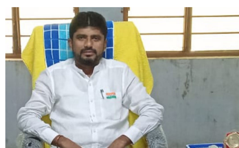
జగదేవపూర్ లో విద్యార్థి అభివృద్ధి మేరకు నచ్చిన కళాశాన్ని ప్రతి ఒక్కరూ సద్వినియోగం చేసుకోవాలని గ్రూపులో మీడియల్ అడ్మిషన్లు పొందే గప్పు అవ విద్యార్థులకు వారి తల్లిదండ్రులకు పిలుపునిచ్చారు.

తెలుగు మీడియల్ కలదు. అదేవిధంగా మండల పరిసర విద్యార్థిని విద్యార్థులకు మరో తీవ్ర కబురు ఈ విద్యా సంవత్సరం నుండి ప్రభుత్వ కళాశాలలో నూతనంగా ఎం.ఇ.సి తెలుగు ఇంగ్లీష్ మీడియల్ పాటు ఒకేషన్ లో ఎం.పి.హెచ్. డబ్ల్యు. ఎం. హెచ్. పి. డబ్ల్యు. పారామెడికల్ కేర్స్ కోర్సులను ప్రారంభించుకోవాలి. జగదేవపూర్ లో ప్రతి విద్యార్థి పై ప్రత్యేకించి అమాయిలపై ప్రత్యేక చొరవ చూపించి కార్పొరేట్ కళాశాలకు దీటుగా అనుభవిస్తున్న అధ్యాపకులచే విద్యాబోధనను అందిస్తూ నిరంతర అధ్యాపకుల పర్యవేక్షణలో విద్యార్థులను వారి తల్లిదండ్రులను ప్రోత్సహిస్తూ నాణ్యమైన విద్యను అందించుటకు పక్కా ప్రణాళికతో ప్రతి విద్యార్థి వారి తల్లిదండ్రులు అడ్మిషన్ విషయంలో బాగా ఆలోచించి అపార అనుభవిస్తున్న రెగ్యులర్ అధ్యాపకులు కలిగిన ప్రభుత్వ జూనియర్ కళాశాల