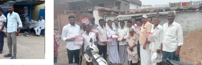
రాంపూర్ లో నిర్వహిస్తున్న బిజెపి కార్యక్రమం

నిర్మల్ జిల్లా నర్సాపూర్, ఆగస్టు 7 అమృత్ తెలంగాణ రాంపూర్, నర్సాపూర్ మండలకేంద్రంలో ఈరోజు మహా సంపర్క అభియాన్ కార్యక్రమం నిర్వహించడం జరిగింది. ప్రధాని నరేంద్ర మోడీ పాలనలో దేశం ఏవిధంగా అభివృద్ధి చెందిందో, అదేవిధంగా రాష్ట్ర కాంగ్రెస్ ప్రభుత్వం ఇప్పి రోజుల్లో ప్రజలకు ఇచ్చిన హామీలను తుంగలో తొక్కిందని,