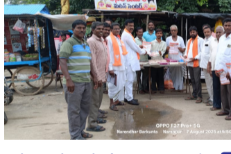
మా సంపర్క అభియాన్ కార్యక్రమం నిర్వహిస్తున్న బిజెపి నాయకులు