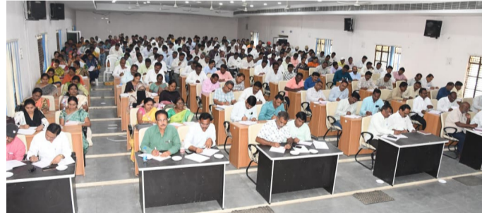
హాజరైన జిల్లా అధికారులు