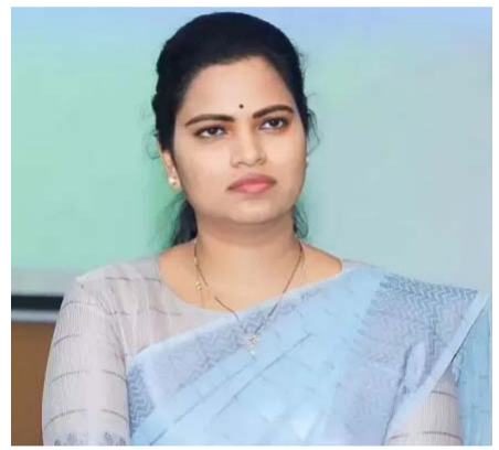
అమరావతి (తెలుగోడు), జనవరి 31 :

లడ్డూ వివాదంపై వీధుల్లోకి దిగిన నేతలు.. అంబటి రాంబాబును అడ్డుకున్న టీడిపి శ్రేణులు.. పోలీసులపై అంబటి ఆగ్రహం.. పల్నాడులో విదదల రజనీ కారుకు అడ్డంకి.. ఆలయాల వద్దే రాజకీయ ఘర్షణలు..