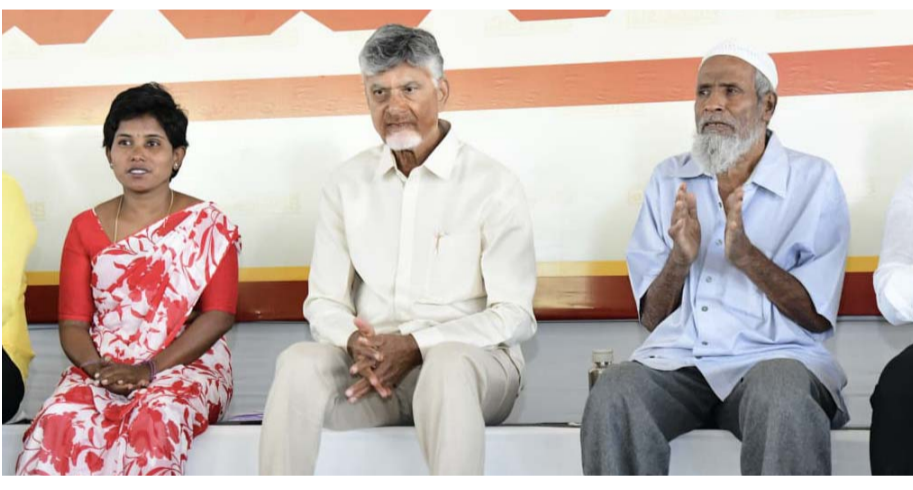
(మొదటి పేజి (తరువాయి))