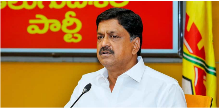
(మొదటి పేజి (తరువాయి))