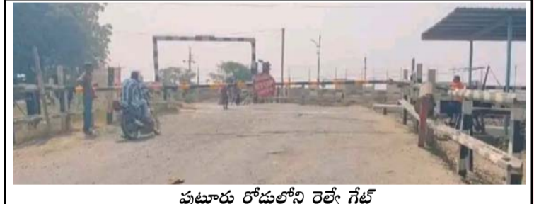
పుట్లూరు రోడ్డులోని రైల్వే గేట్