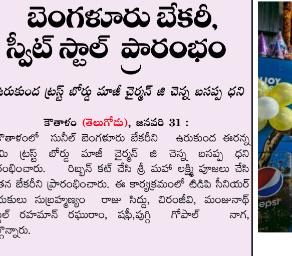
బెంగళూరు బేకరీని ప్రారంభిస్తున్న దృశ్యం