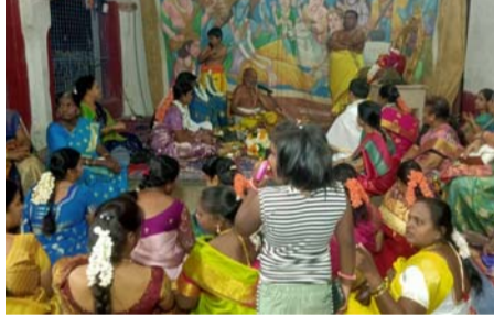
శ్రీ ప్రసన్న లక్ష్మి వెంకటేశ్వర స్వామి కల్యాణోత్సవం జరుగుతున్న దృశ్యం