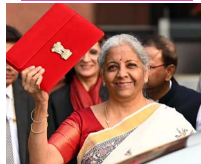
న్యూ ఢిల్లీ (తెలుగోడు), జనవరి 31 :

ఉదయం 11 గంటలకు బడ్జెట్ ప్రవేశ పెట్టనున్నారు. ఈ వార్షిక బడ్జెట్ ఎప్పుడీలాగే కొన్ని మొదలుపెట్టే విధులు ఉండేలా ఉంటుందన్న చర్చ సాగుతోంది. పెద్దగా ప్రభావితం కాకపోవచ్చునని అభిప్రాయాలు వ్యక్తం అవుతున్నాయి. ఉదయం 11 గంటలకు సభ ప్రారంభం కాగానే లోక్ సభలో బడ్జెట్ ప్రవేశ పెడతారు. బడ్జెట్ ప్రసంగం అనంతరం సభ వాయిదా పడుతుంది. అయితే ఆదివారం ప్రవేశ పెట్టనున్న కేంద్ర ఆర్థిక బడ్జెట్ 2026 కోసం అందరూ ఎంతో ఆసక్తిగా ఎదురు చూస్తున్నారు. ముఖ్యంగా పన్ను చెల్లింపుదారులు తమకు ఆటంకం లభించేలా బడ్జెట్ ఉంటుందనే ఆశతో ఉన్నారు. వారి ఆశలు నిజం చేసే దిశగానే కేంద్రం బడ్జెట్ ఉండనుందని సమాచారం. పన్నుల విషయంలో కీలక మార్పులు జరగవచ్చని ఆర్థిక నిపుణులు చెబుతున్నారు. బడ్జెట్ 2026లో ఆదాయపు పన్ను నిబంధనలో పలు మార్పులు రానున్నాయి. ముఖ్యంగా ఉద్యోగులు, స్వయం ఉపాధి పొందుతున్న వ్యక్తులు, సీనియర్ సిటిజన్లకు లాభం చేకూరేలా ఈ మార్పులు కేంద్రం తీసుకువస్తుందని సమాచారం. పన్ను నిర్మాణాన్ని సరళీకృతం చేయడం, పన్ను విషయంలో భారాన్ని తగ్గించడం, పారదర్శకత, డిజిటల్ పన్ను వ్యవస్థను ఎంకోవడానికి ఎక్కువ మందిని ప్రోత్సహించడమే లక్ష్యంగా బడ్జెట్ ఉండనుందన్న వార్తలు వస్తున్నాయి. పాత ఆదాయపు పన్ను చట్టం 1961 నుంచి.. కొత్త ఆదాయపు పన్ను చట్టం 2025 వరకు సరళమైన పరివర్తనలపై ప్రభుత్వం దృష్టి సారించింది. సత్కర పన్ను వాపసులు, సరళీకృత పన్నుతి (మిగతా 2లో)