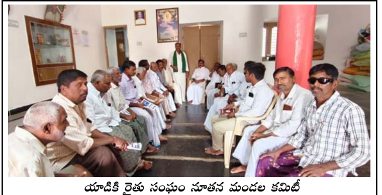
యాడికి రైతు సంఘం నూతన మండల కమిటీ