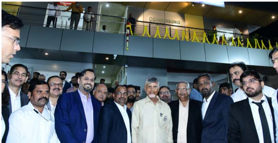
కుప్పం (తెలుగోడు), జనవరి 31 :