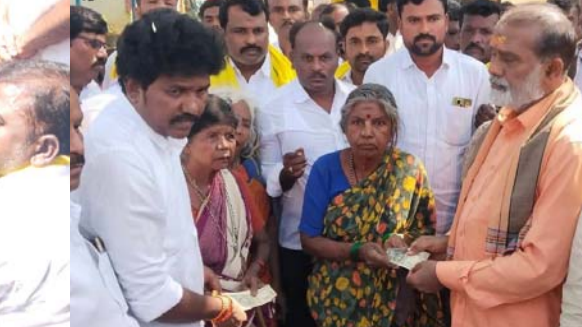
జనవసస్థలిలో ఎమ్మెల్యే ఎమ్మెల్యే రాజు, మాజీ ఎమ్మెల్యే గుండుమల తిప్పేస్వామికి స్వాగతం పలికిన నాయకులు