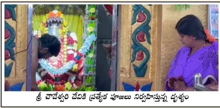
శ్రీ చౌడేశ్వరి దేవికి ప్రత్యేక పూజలు నిర్వహిస్తున్న దృశ్యం

పెద్దకడబూరు (తెలంగాణ), జనవరి 31 : పెద్దకడబూరు గ్రామంలోని కొలువై ఉన్న శ్రీశ్రీ శ్రీ చౌడేశ్వరిదేవి 29వ జ్యోతి మహోత్సవం శనివారం తొగట వీరక్షత్రియ యూత్ అడ్వెన్చర్లలో భక్తిశ్రద్ధల సమయం ప్రారంభమైంది. ఈ సందర్భంగా అమ్మవారి విగ్రహం, పట్టు వస్త్రాలను గ్రామ పురవీధుల గుండా ఊరేగింపుగా తీసుకెళ్లి ఆలయంలో సమర్పించారు. ఉదయం ఆలయ అర్చకులు తోటప్పయ్య స్వామి గణపతి పూజ, క్షీరాభిషేకం, బిల్వార్చన, శతనామావళి, కుంకుమార్చన, మంగళహారతి తదితర ప్రత్యేక పూజలను ఆాంక్షించారు. సాయంత్రం మల్లికార్జున స్వామి దేవాలయం నుంచి తుంగభద్ర నదీజలాన్ని మంగళ వాయిద్యాల, కోలాటాలు, భజనలతో ఉత్సవ ఊరేగింపుగా తీసుకువచ్చి చౌడేశ్వరిదేవి అమ్మవారికి గంగాజలాభిషేకం చేశారు. జ్యోతి మహోత్సవం సందర్భంగా గ్రామంతోపాటు పరిసర ప్రాంతాల నుంచి వచ్చిన భక్తులు పెద్ద సంఖ్యలో పాల్గొని అమ్మవారిని దర్శించి ప్రత్యేక పూజలు నిర్వహించి మొక్కులు తీర్చుకున్నారు. ఆదివారం వేకువజామున మల్లికార్జున స్వామి దేవాలయం నుంచి జ్యోతిని మంగళ వాయిద్యాలు, భజనలతో పాటు విద్యుత్ దీపాలంకరణతో గ్రామ వీధుల గుండా ఊరేగింపుగా తీసుకెళ్లి చౌడేశ్వరిదేవి అమ్మవారికి మహా మంగళహారతితో మేలుకొలుపు నిర్వహించనున్నట్లు నిర్వాహకులు తెలిపారు. ఈ మహోత్సవంలో గ్రామ పెద్దలు, యువకులు, మహిళలు అధిక సంఖ్యలో పాల్గొని కార్యక్రమాన్ని ఘనంగా విజయవంతం చేశారు.