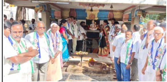
ఆంజనేయస్వామి ఆలయంలో పూజలు నిర్వహిస్తున్న వైఎస్ఆర్ శ్రేణులు