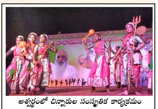
అశ్వరంలో చిన్నాడల సాంస్కృతిక కార్యక్రమం