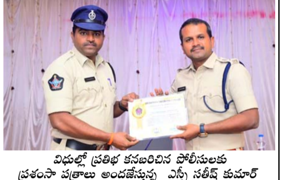
విధుల్లో ప్రతిభ కనబరిచిన పోలీసులకు ప్రశంసా పత్రాలు అందజేస్తున్న ఎస్పీ సతీష్ కుమార్