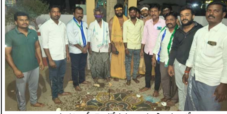
బత్తలపల్లి లక్ష్మి వెంకటేశ్వర ఆలయ ప్రాంగణంలో కొబ్బరికాయలు కొనుక్కున్న వైఎస్ఆర్ఎస్ నేతలు