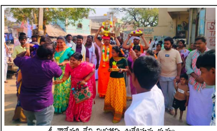
శ్రీ చౌడేశ్వరి దేవి విగ్రహాన్ని ఊరేగిస్తున్న దృశ్యం