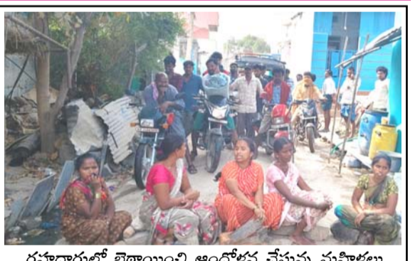
రహదారిలో బైకాయింబి ఆందోళన చేస్తున్న మహిళలు

పెద్దకడబూరు (తెలంగాణ), జనవరి 31 : పెద్దకడబూరు గ్రామంలోని ఎన్టీఆర్ ఒకటో వార్డులో నెలకొన్న డ్రైనేజీ, తాగునీటి సమస్యలను తక్షణమే పరిష్కరించాలని డిమాండ్ చేస్తూ శనివారం అక్కడి మహిళలు రహదారిపై బైకాయింబి ఆందోళన చేపట్టారు. ఈ ఆందోళన కారణంగా రహదారిపై వాహనాల రాకపోకలకు తీవ్ర అంతరాయం ఏర్పడింది. ఒకటో వార్డులో డ్రైనేజీ సరిగా లేక మురుగు నీరు నిల్వ ఉండడంతోపాటు అదే మురుగు నీరు తాగునీటి కుళాయిల్లోకి చేరుతోందని మహిళలు ఆవేదన వ్యక్తం చేశారు. ఇలాంటి పరిస్థితుల్లో తాగునీటిని ఎలా వినియోగించుకోవాలని ప్రశ్నించారు. పలుమార్లు గ్రామ పంచాయతీకి, ప్రజాప్రతినిధులకు, సంబంధిత అధికారులకు ఫిర్యాదు చేసినా పట్టించుకోలేదని ఆరోపించారు. డ్రైనేజీ సమస్యపై ఎంపీడీవో కార్యాలయంలో ఫిర్యాదు చేసినా స్పందన లేదని, గ్రామ సర్పంచ్ కు ఫోన్ చేసినా సమాధానం రాలేదని మహిళలు మండిపడ్డారు. కొందరు మురుగు నీరు బయటకు వెళ్లకుండా అడ్డుకట్ట వేయడం వల్లే ఈ సమస్య తీవ్రతరమైందని వారు తెలిపారు. సమస్యలు పూర్తిగా పరిష్కరించే వరకు ఆందోళన విరమించేది లేదని హెచ్చరించారు. మహిళల ఆందోళనతో ట్రాఫిక్ నిలిచిపోవడంతో వాహనదారులు పోలీసులకు సమాచారం అందించారు. ఎస్ఐ నిరంజన్ రెడ్డి అధ్యక్షులలో పోలీసులు సంఘటన