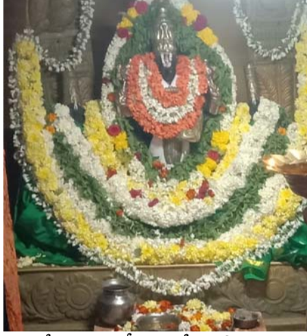
శ్రీ ప్రసన్న లక్ష్మి వెంకటేశ్వర స్వామికి పూలతో అలంకరణ