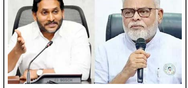
అమరావతి (తెలుగోడు), జనవరి 31 :

మాజీ మంత్రి అంబటి రాంబాబుకు పార్టీ అధినేత, మాజీ ముఖ్యమంత్రి వైఎస్ జగన్ మోహన్ రెడ్డి ఫోన్ చేసి పరామర్శించారు. అంబటి ఆరోగ్య పరిస్థితిని అడిగి తెలుసుకున్న వైఎస్ జగన్ ధైర్యం చెబుతూ, రాష్ట్రం పూర్తిగా జంగిల్ రాజ్ గా మారిపోయిందని తీవ్ర ఆగ్రహం వ్యక్తం చేశారు. ప్రజాస్వామ్యాన్ని ఖానీ చేస్తూ చంద్రబాబు ఆటంకం రాజ్యాన్ని నడుపుతున్నారని మండిపడ్డారు. చంద్రబాబు దుర్మార్గులు రోజురోజుకూ పెరిగిపోతున్నారని వైఎస్ జగన్ విమర్శించారు. ఉద్దేశపూర్వకంగానే దాడులు, హత్యాయత్నాలకు దిగుతున్నారని ఆరోపించారు. ప్రజలపై చూస్తున్నారని, ఈ అరాచక పాలనను ప్రజలు సహించలేరని స్పష్టం చేశారు. రక్షణ కల్పించాలని పోలీసులు ప్రేక్షకుల్లా వ్యవహరించడం అత్యంత దురదృష్టకరమన్నారు. అంబటికి వైఎస్సార్ సీపీ మొత్తం అండగా ఉంటుందని వైఎస్ జగన్ భరోసా ఇచ్చారు. అంబటిపై జరిగిన హత్యాయత్నాన్ని వైఎస్సార్ సీపీ అత్యంత సీరియస్ గా తీసుకుంది. రాష్ట్రంలో శాంతి భద్రతలు పూర్తిగా క్షీణించాయని ఆందోళన వ్యక్తం చేసింది. తిరుమల లడ్డూ విషయంలో సిట్ ల్యాబ్ రిపోర్టుల ఫలితాలతో అడ్డంగా దొరికిపోయిన చంద్రబాబు తన వైఖరిని కట్టిపెట్టుకునేందుకు హింసను రాజీవున్నారని ఆరోపించింది. ఆ కుట్రలో భాగంగానే రాష్ట్రవ్యాప్తంగా వరుస దాడులు జరుగుతున్నాయని, పథకం ప్రకారమే అంబటిపై హత్యాయత్నం చేశారని వైఎస్సార్ సీపీ పేర్కొంది. ఈ ఘటనను కేంద్ర హోంశాఖ దృష్టికి తీసుకువచ్చిన వైఎస్సార్ సీపీ నిర్ణయించింది. అంబటిపై జరిగిన హత్యాయత్నం, రాష్ట్రంలో క్షీణించిన శాంతి భద్రతల పరిస్థితిపై కేంద్ర హోంశాఖకు వైపీ సుబ్బారెడ్డి లేఖ రాయనున్నట్లు పార్టీ వర్గాలు వెల్లడించాయి. ప్రజాస్వామ్యాన్ని కాపాడాలని ప్రభుత్వమే హింసకు అండగా నిలుస్తోందని, ఈ అరాచకానికి తీవ్ర సమాధానం ప్రజలే ఇస్తారని వైఎస్సార్ సీపీ హెచ్చరించింది.