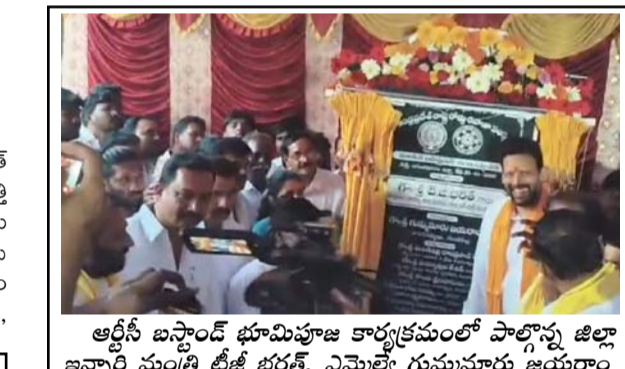
ఆర్టీసీ బస్టాండ్ భూమిపూజ కార్యక్రమంలో పాల్గొన్న జిల్లా ఇన్చార్జ్ మంత్రి టీజీ భరత్. ఎమ్మెల్యే గుమ్మూరు జయరాం

గుత్తి నూతన ఆర్టీసీ బస్టాండ్ నిర్మాణానికి జిల్లా ఇన్చార్జ్ మంత్రి పి.సి భరత్ భూమి పూజ చేశారు. మండల కేంద్రంలో శిథిలావస్థకు చేరుకున్న గుత్తి ఆర్టీసీ బస్టాండ్ స్థానంలో నూతన బస్టాండ్ నిర్మించడానికి ప్రభుత్వం ఐదు కోట్ల రూపాయల నిధులను విడుదల చేసింది. దీంతో శనివారం ఆర్టీసీ అధికారులు కొత్త బస్టాండ్ నిర్మాణం పనులకు భూమి పూజ కార్యక్రమం చేపట్టారు. ఈ కార్యక్రమానికి ముఖ్య అతిథులుగా ఎమ్మెల్యే జయరాం,