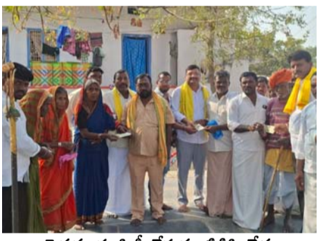
పెన్నన్లు పంపిణీ చేస్తున్న టీడీపీ నేతలు