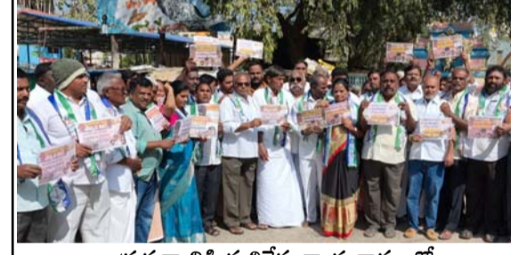
ప్రభుత్వానికి వ్యతిరేకంగా ప్ల కార్డులతో నిరాదాని చేస్తున్న వైఎస్సార్లపై శ్రేణులు