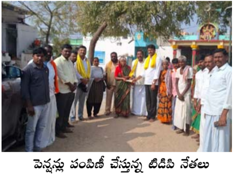
పెన్నన్లు పంపిణీ చేస్తున్న టీడీపీ నేతలు