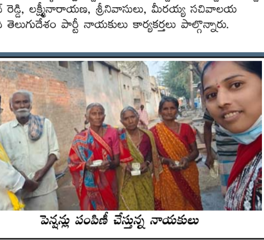
పెన్నెన్లు పంపిణీ చేస్తున్న నాయకులు

పంపిణీ కార్యక్రమం నిర్వహించారు. సాధారణంగా ప్రతి నెలా ఒకటి తారీఖున పెన్నెన్లు పంపిణీ జరుగుతుంది. అయితే, ఈసారి ఒకటి తేదీ ఆదివారం (సెలవు దినం) కావడంతో, లబ్ధిదారులకు ఎటువంటి ఇబ్బంది కలగకూడదనే ఉద్దేశంతో ప్రభుత్వం ఒక రోజు ముందే అంటే శనివారమే పెన్నెన్లు పంపిణీకి శ్రీకారం చుట్టింది. సెలవు రోజు వచ్చినప్పటికీ, లబ్ధిదారులకు సకాలంలో పెన్నెన్లు అందాలన్న తపనతో ముందస్తుగా పంపిణీ చేయడం కూటమి ప్రభుత్వ చిత్తశుద్ధికి నిదర్శనం." అని వారు పేర్కొన్నారు. ఈ కార్యక్రమంలో స్థానిక డి.సి.సీ. కార్యకర్తలు మరియు సచివాలయ నిబ్బంది పాల్గొన్నారు.