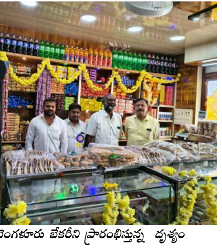
బెంగళూరు బేకరీని ప్రారంభిస్తున్న దృశ్యం